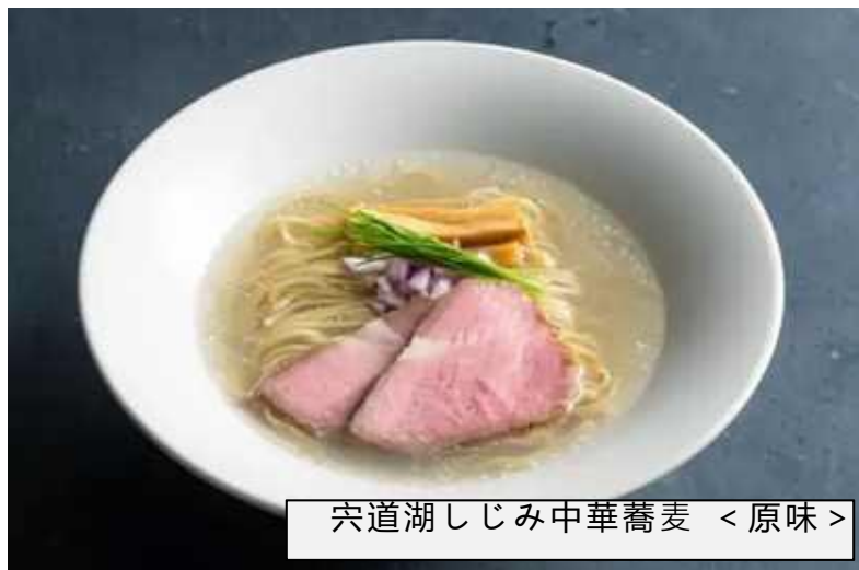
穴道湖しじみ中華蕎麦 < 原味 >