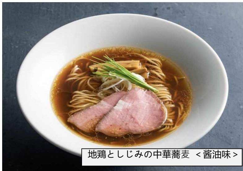
地鶏としじみの中華蕎麦 < 醤油味 >