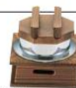
(-合炊飯) 田园炊饭装置