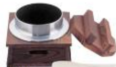
(-合炊飯) 田园氟化乙烯加工装置