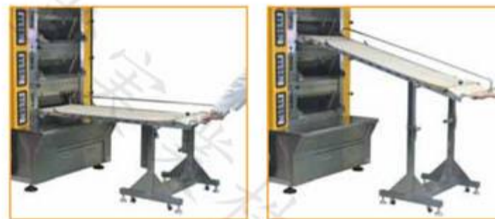
使用收纳箱支架的样子