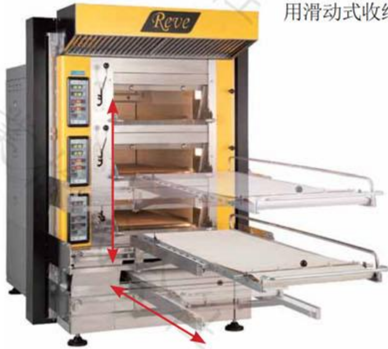
• 升降机 REO-E□3(4)