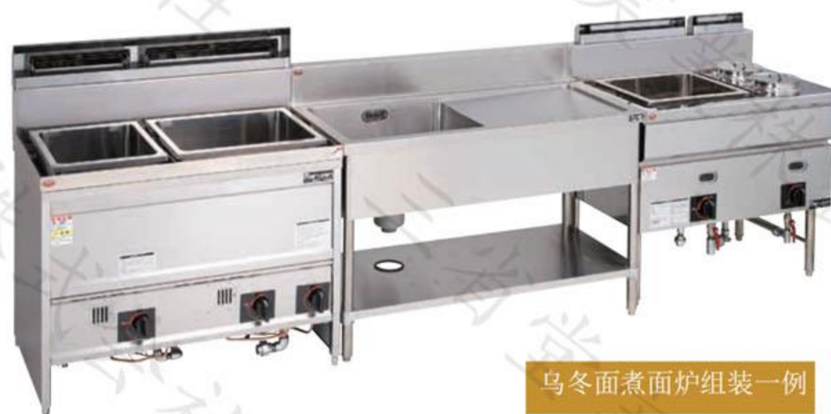
乌冬面煮面炉组装一例