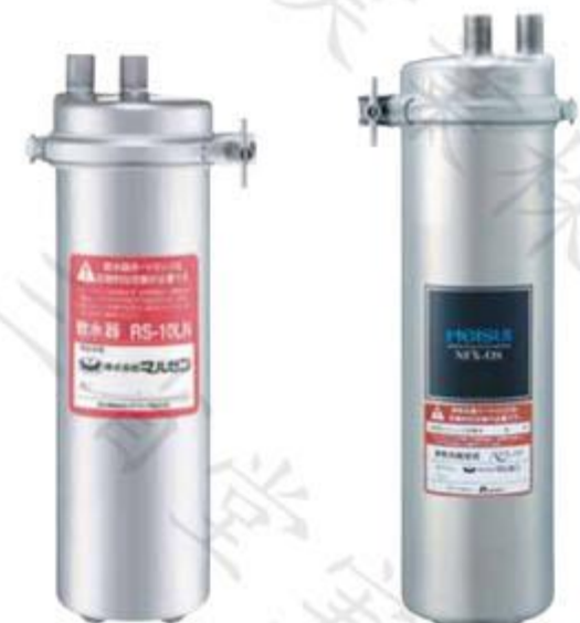
RS-10LN 外形尺寸 150×120×380