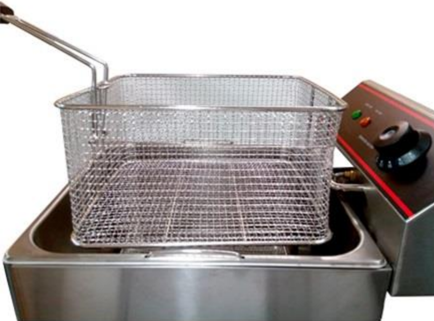
揚げ上がったら油切り!