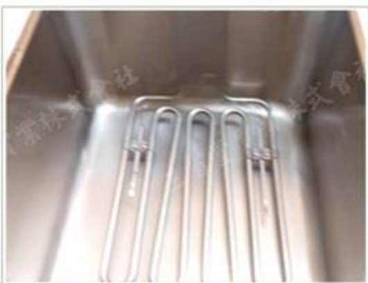
ヒーターをセット!