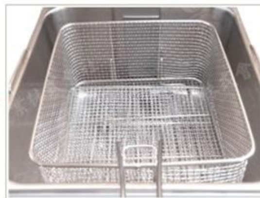
揚げカゴセットで完了!