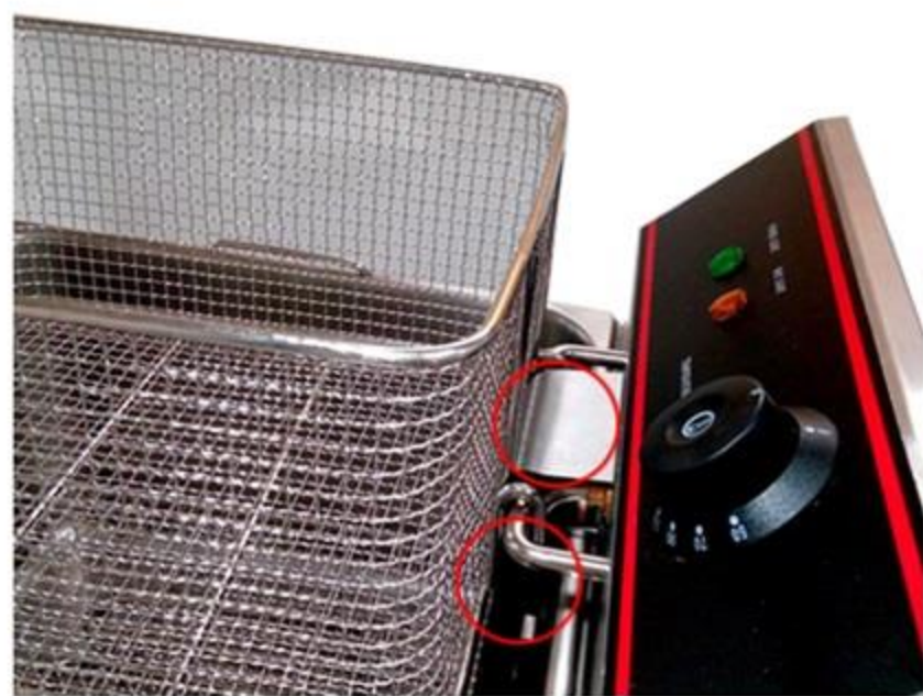
本体のレバーを2本の爪でしっかり挟んで油切り!