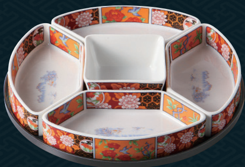
390-3-10H 7,800円 金彩伊万里ミニオードブル 24.5×6.5cm