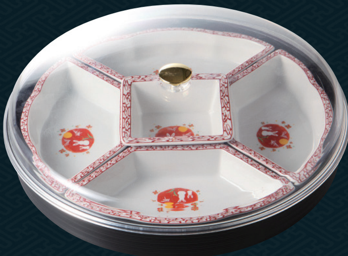
390-4-10H 13,500円 赤うさぎフード付オードブル 39×8cm