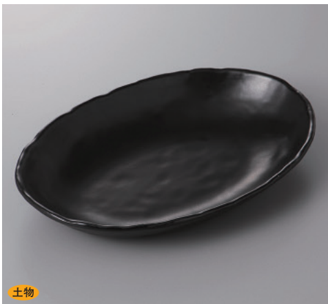
土物 385-10-79H 1,230円 黒釉小判カレヘ皿 26.6×18.4×4cm