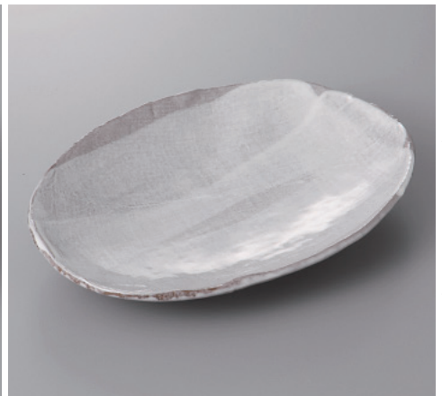
385-9-84H 1,250円 白刷毛目8号小判皿 24×17×4cm