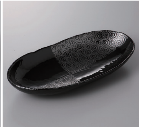
385-3-32H 2,050円 銀彩うず長盛皿レー(大) 29×14.3×4.6cm