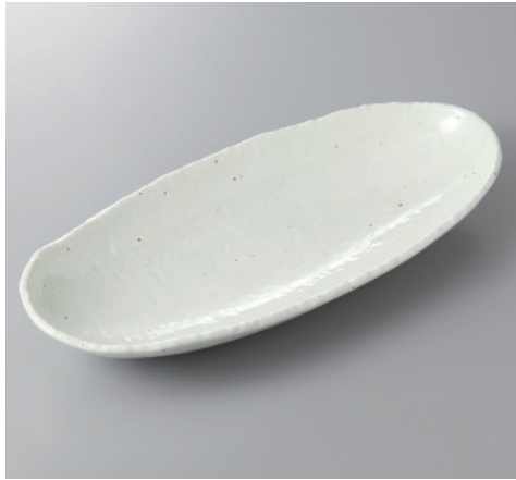
385-2-32H 2,500円 新粉引石目長盛皿 32.5×14×4.5cm