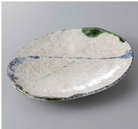
385-8-84H 1,250円 織部流線8号小判皿 24×17×4cm