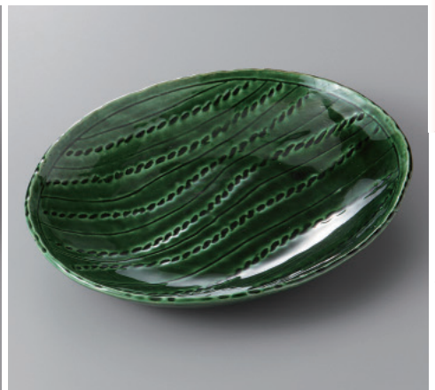
385-12-35H 1,150円 総織部縄目楕円皿 24×19.6×3.8cm

盛皿、オードブル 大鉢、盛鉢、組鉢 組丼、ボール 酒器、箸置き、卓上小物 箸、スリ、レンジ、盛皿