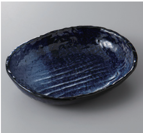
385-7-33H 1,210円 雲海バスケット大 22.4×17×4.8cm