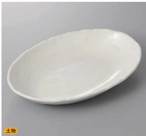
土物 385-11-79H 1,230円 白釉小判カレヘ皿 26.6×18.4×4cm