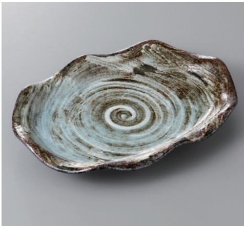
385-4-60H 1,700円 うず潮花型小判皿(大) 24.4×17×3.5cm