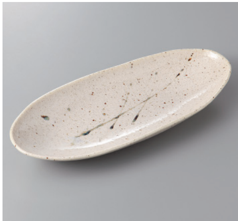
385-5-45H 1,400円 アメ乱長盛皿 32×13.5×4cm