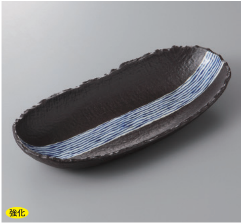
強化 385-1-77H 3,420円 京清水強化黒釉10.0楕円ボール 29.5×13.5×4.5cm