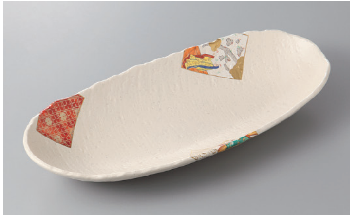
376-6-5H 4,680円 白釉百人一首楕円皿 33.5×15×4.5cm