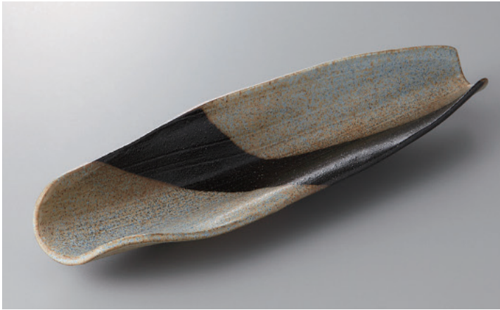
376-5-33H 5,600円 黒潮葉月大 40.5×11.5×6.5cm