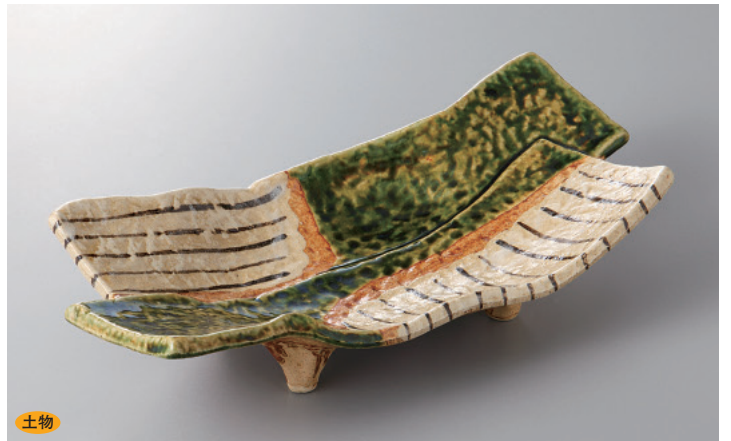
376-3-71H 5,700円 粉引塗分け13.0長皿 40.4×13.6×2.4cm