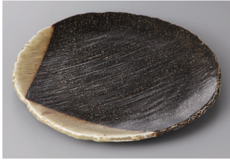
330-5-21H 2,400円 星野涼8.0丸皿 25.5×2cm