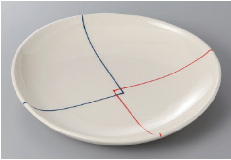
330-1-71H 2,900円 結び一珍8.0皿 24.5×23.4×3.3cm