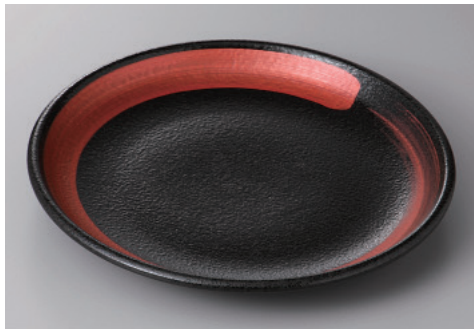
330-11-22H 2,150円 赤銀彩8.0丸皿 24.6×3.2cm