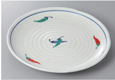
330-8-34H 2,400円 赤絵とうがらし大皿 29.7×3.3cm