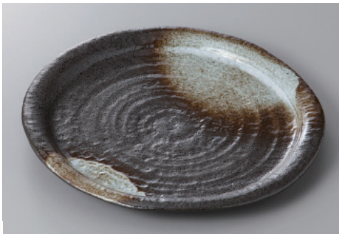
330-10-35H 2,200円 白吹天目8.0波瀾皿 24.5×2.8cm