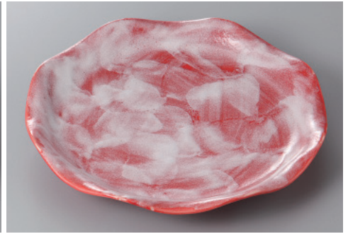
330-3-60H 2,500円 赤彩花花型8.0皿 25×3.5cm