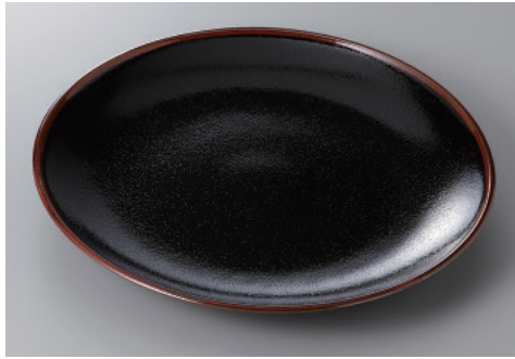
330-2-43H 2,550円 ゆず天目9.0皿 28.7×4.2cm