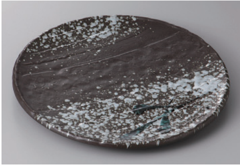
330-4-26H 2,400円 雪化粧8.0皿 25.2×2cm