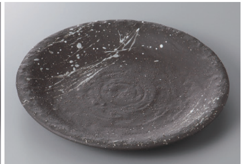
330-12-25H 1,800円 吹雪石目8.0皿 25.5×3.5cm