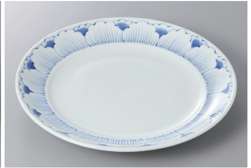
330-9-35H 2,300円 ろんど8.0丸皿 25×3.2cm