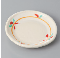
311-16-77H 660円 赤絵京小花 3.5丸皿 10.8×1.5cm