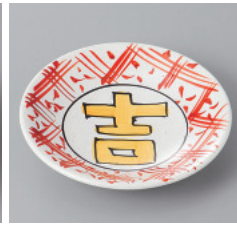
311-35-25H 630円 吉祥手描き小皿 10×2cm