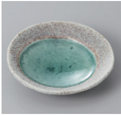
311-3-32H 740円 月光丸波 30皿 9.4×2cm