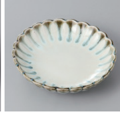
311-11-71H 680円 うのぶ流し菊型 3.6丸皿 11.2×2.5cm