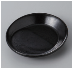
311-38-43H 620円 ヘルシー 醤油皿黒 10.3×9×2cm