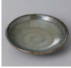
311-10-2H 650円 笠間壺 3.0丸皿 9.5×2cm