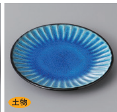
311-23-25H 680円 黒土化粧しのぎ 3.0皿(トルコ) 9.5×1.5cm