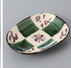
311-17-51H 800円 織部格子精円皿(小) 11.8×8.8×2.5cm