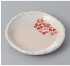
311-2-71H 700円 おしぼな(赤)小皿 10.7×10.2×1.7cm