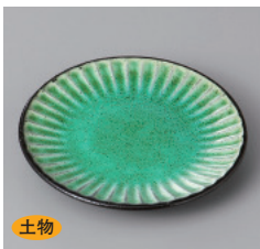
311-21-25H 680円 黒土化粧しのぎ 3.0皿(グリーン) 9.5×1.5cm