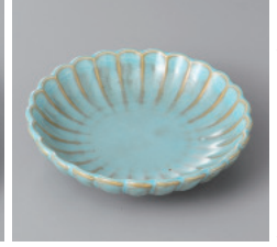
311-12-71H 680円 みずあさぎ菊型 3.6丸皿 11.2×2.5cm