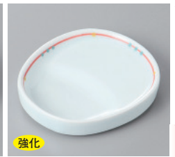
311-30-79H 610円 駒筋小判変り千代久 9.3×8×1.5cm