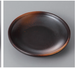
311-6-77H 680円 焼締め3.5寸丸皿(ハマ付) 10×2cm