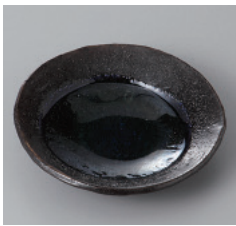
311-27-33H 770円 青い月 9cm丸皿 9.2×2.2cm