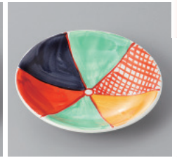
311-36-25H 630円 まり手描き小皿 10×2cm