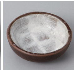
311-41-77H 600円 備前志野 2.5寸丸鉢 7.1×2.4cm