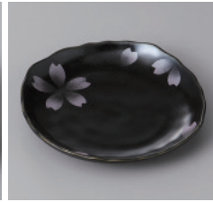
311-5-10H 690円 黒桜 4寸皿 12.5×12×2cm