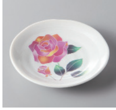
311-7-10H 700円 バラ園 3.5皿 12×2cm