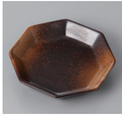
311-1-77H 720円 焼締め3.0寸八角皿 9.7×9.1×2cm