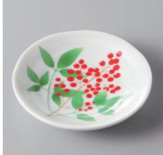
311-14-10H 650円 南天 3.0皿 9.7×2cm