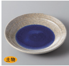
311-4-22H 700円 藍華 3.3丸皿 10.5×2cm