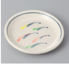
311-9-77H 680円 武蔵野 3.5丸皿 11×1.4cm