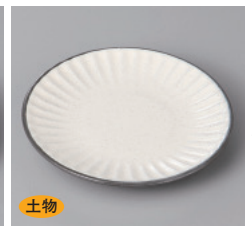
311-24-25H 680円 黒土化粧しのぎ 3.0皿(ホワイト) 9.5×1.5cm