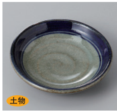
311-37-1H 630円 手造灰袖千段小皿 9.5×2.2cm