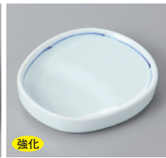
311-29-71H 610円 青ライン小判変り千代久 8×9.3×1.5cm