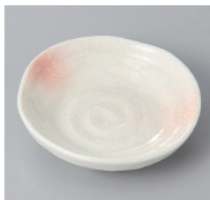
311-19-43H 650円 弥生ろくべい小皿 9.6×2.4cm