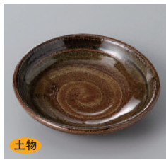
311-28-1H 630円 伊良保吹 3.0皿 9.2×2.2cm