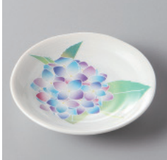
311-15-10H 650円 紫陽花 3.0皿 9.7×2cm