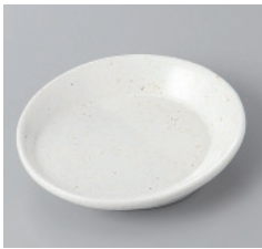
311-39-43H 620円 ヘルシー 醤油皿白 10.3×9×2cm