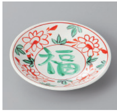
311-31-25H 630円 福花紋手描き小皿 10×2cm