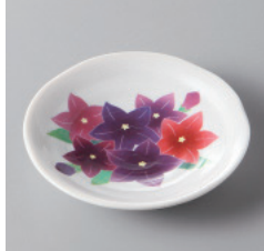
311-13-10H 650円 桔梗 3.0皿 9.7×2cm