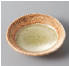
311-25-33H 630円 山吹き 9cm丸皿 9.2×2.2cm