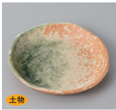
311-26-77H 650円 若草 3.0丸皿 9.5×1.4cm