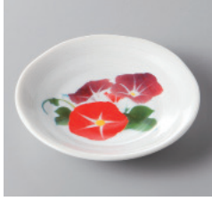
311-8-10H 700円 朝顔 3.5皿 12×2cm