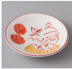
311-34-25H 630円 猫手描き小皿 10×2cm