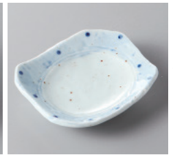
311-42-77H 600円 朝なぎ小皿 10×9×2.2cm