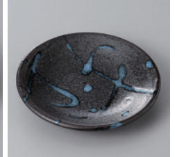
311-18-71H 660円 黒潮丸小皿 10.8×2cm