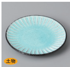
311-22-25H 680円 黒土化粧しのぎ 3.0皿(ブルー) 9.5×1.5cm