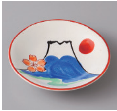
311-32-25H 630円 富士手描き小皿 10×2cm