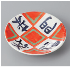
311-33-25H 630円 笑門来福手描き小皿 10×2cm