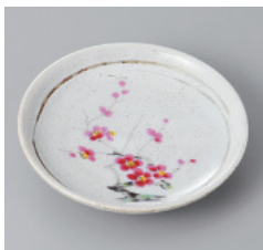
311-20-23H 650円 野書紅梅 3.3皿 10×2.3cm