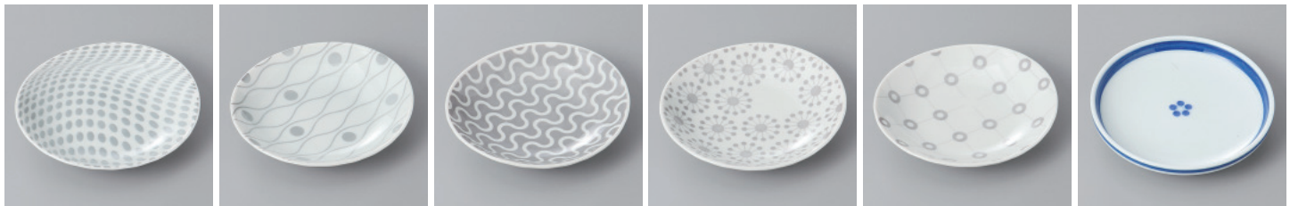
310-13-93H 1,000円 有田焼 ドット楕円小皿(G) 5入 12×11×2.5cm 310-14-93H 1,000円 有田焼 タテワク楕円小皿(G) 5入 12×11×2.5cm 310-15-93H 1,000円 有田焼 アーチ楕円小皿(G) 5入 12×11×2.5cm 310-16-93H 1,000円 有田焼 ハナツツ楕円小皿(G) 5入 12×11×2.5cm 310-17-93H 1,000円 有田焼 マルコウシ楕円小皿(G) 5入 12×11×2.5cm 310-18-93H 850円 有田焼 夢路3号皿 10入 10×2cm