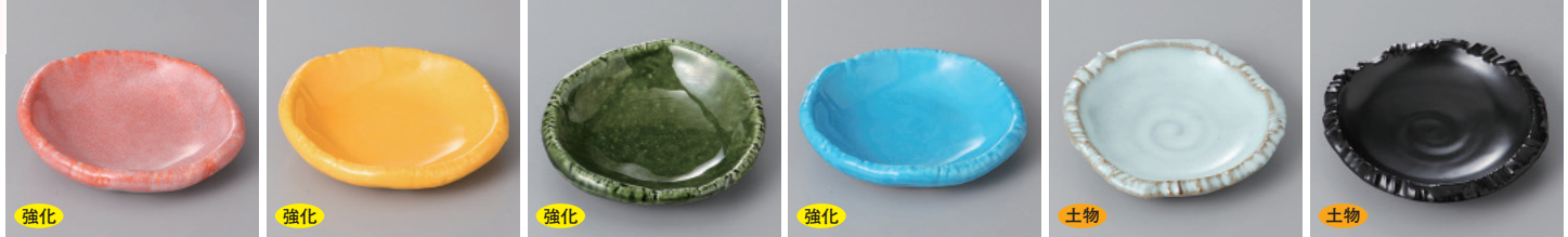
310-31-5H 900円 赤染小皿 10×9.3×2.5cm 310-32-5H 820円 黄袖小皿 10×9.3×2.5cm 310-33-5H 820円 織部小皿 10×9.5×2.5cm 310-34-5H 820円 トルコブルー小皿 10×9.3×2.5cm 310-35-35H 790円 春がすみ乱切小皿 10.5×2cm 310-36-35H 750円 黒マツ乱切小皿 10.5×2cm