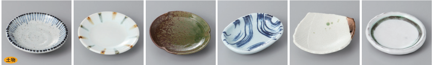
310-37-79H 710円 細十草3.0丸皿 10.5×2cm 310-38-71H 750円 瀧二色刷毛3.5皿 11.1×2cm 310-39-71H 750円 南蛮オリベ三ツ押3.5丸皿 10.8×4.2cm 310-40-51H 700円 海流玉淵4.0小判皿 11.7×8.6×2.5cm 310-41-2H 730円 金彩おりべ散らし千代口 11×9.5×2.5cm 310-42-71H 720円 あおい3.0小皿 10.3×1.2cm