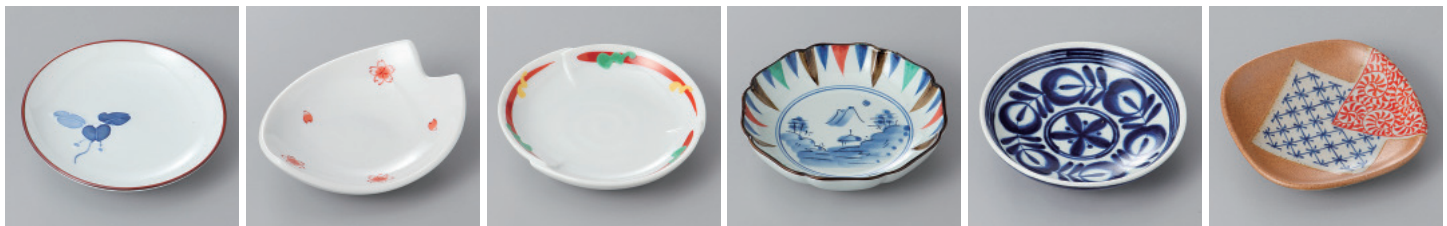
310-19-93H 950円 有田焼 まんりょう3号皿 10入 10.5×2cm 310-20-93H 800円 さくら桜鉢 10入 11.6×9.5×3.5cm 310-21-93H 780円 錦刷毛三ツ折小皿 10×16入 10×2cm 310-22-93H 700円 有田焼 十草山水小皿 10入 11.6×2.6cm 310-23-93H 680円 有田焼 モダンブループレート(S) 5入 10×2cm 310-24-93H 650円 地紋唐草四角姫小皿 10入 8.7×8.7×1.8cm