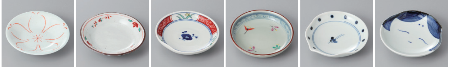
310-1-93H 1,300円 有田焼 花ひら小皿 10入 11×2cm 310-2-93H 1,000円 有田焼 京赤絵小皿 10入 10.5×2cm 310-3-93H 900円 有田焼 古代花小皿 10入 10.2×2.5cm 310-4-93H 1,000円 有田焼 花小紋3号皿 10入 9.5×2.5cm 310-5-93H 1,100円 有田焼 千鳥水玉小皿 10入 10.5×10×2.5cm 310-6-93H 850円 有田焼 お福さん小皿 10入 10.5×10×2cm