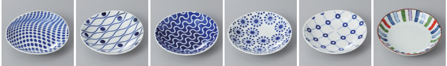
310-7-93H 1,000円 有田焼 ドット楕円小皿(B) 5入 12×11×2.5cm 310-8-93H 1,000円 有田焼 タテワク楕円小皿(B) 5入 12×11×2.5cm 310-9-93H 1,000円 有田焼 アーチ楕円小皿(B) 5入 12×11×2.5cm 310-10-93H 1,000円 有田焼 ハナツツ楕円小皿(B) 5入 12×11×2.5cm 310-11-93H 1,000円 有田焼 マルコウシ楕円小皿(B) 5入 12×11×2.5cm 310-12-93H 950円 有田焼 錦十草小皿 5入 10.5×2cm