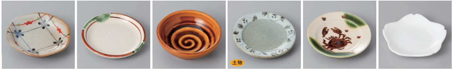
310-25-93H 650円 格子六角姫小皿 10入 9×8.6×1cm 310-26-77H 830円 織部3.5丸皿 11×1.5cm 310-27-35H 820円 アメ軸うずタレ小皿 9.4×3.4cm 310-28-79H 820円 唐津椿3.0丸皿 9.6×1.5cm 310-29-78H 850円 織部かに絵3.0丸皿 9.8×1.5cm 310-30-21H 780円 白さくら9cmプレート 9×1cm