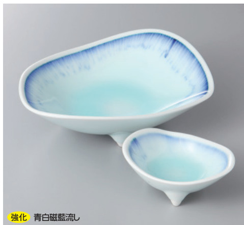
強化 青白磁藍流し

61-1-71H 3,360 円 刺身鉢 18.5×14.3×5.8cm 61-2-71H 1,450 円 千代口 9.5×7.8×4cm