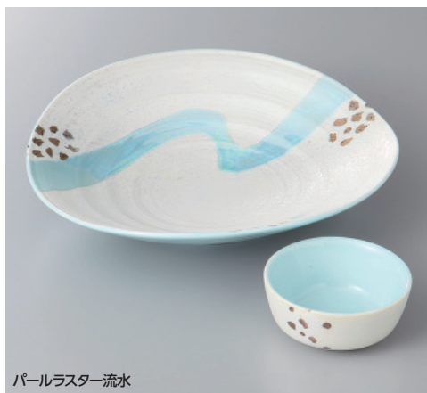
パールラスター流水

61-5-22H 3,200 円 黒丸高台向付 16.5×5.7cm 61-6-22H 1,380 円 黒丸千代口 6.5×3.3cm