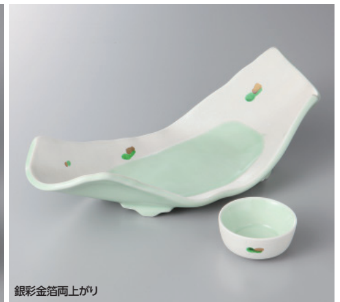
銀彩金箔両上がり

60-9-78H 4,020円 刺身鉢 18.3×14.2×5.6cm 60-10-78H 1,520円 千代口 9.3×7.8×4cm