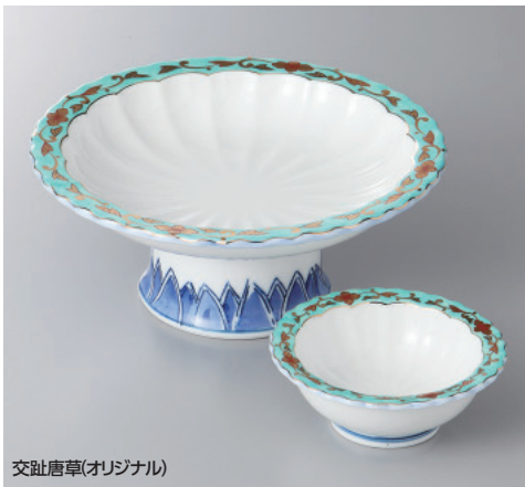
交趾唐草(オリジナル)

60-13-33H 3,500円 高台刺身鉢 16×7cm 60-14-33H 1,500円 千代口 8.6×3.2cm