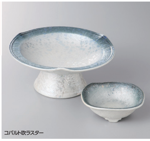
コバルト吹ラスター

58-1-57H 4,450 円 三ツ押高台刺身皿 16.7×7.5cm 58-2-57H 1,480 円 三ツ足千代口 8.3×3cm