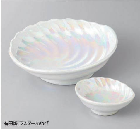
有田焼 ラスターあわび

58-5-5H 4,190 円 高台皿 15×5.2cm 58-6-5H 1,670 円 千代口 6.8×2.8cm