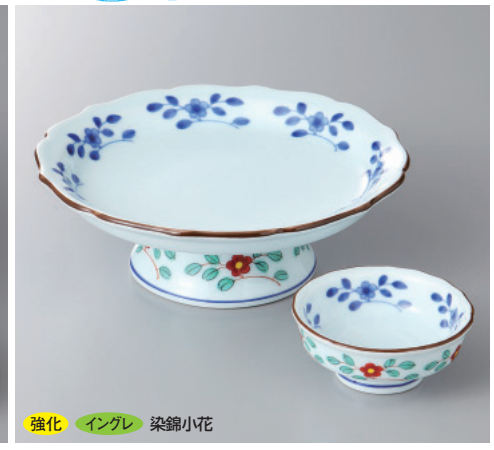
強化 イングレ 染錦小花

58-3-53H 4,400 円 金銀ちらし向付 16.5×4.6cm 58-4-53H 900 円 丸千代口 6.6×2.2cm