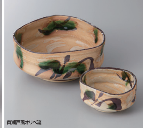
黄瀬戸風オリベ流

58-9-79H 4,430 円 刺身鉢 14.2×5.5cm 58-10-79H 1,640 円 千代口 7.8×3.7cm