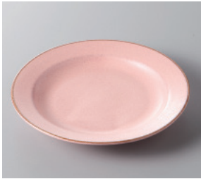
291-23-30H 380円 プリマヴェラリム 5.0皿(ローズ) 60入 16×2.2cm