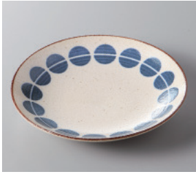
291-12-57H 500円 リング16cmプレート 16.2×3cm