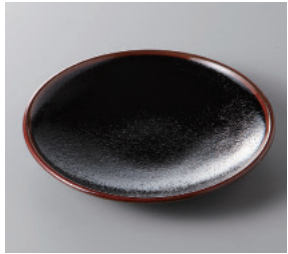
291-1-25H 580円 ゆず柑天目丸 5.0皿 16.4×2.3cm