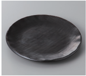
291-13-35H 470円 黒マツカヤメ 5.0皿 16.2×2cm