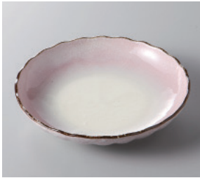
291-5-79H 560円 小雪紫菊型 5.0皿 16.5×3.5cm 291-6-79H 460円 小雪紫菊型 4.0皿 13.8×3cm