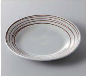
291-10-57H 550円 らいん(グレー)16cmプレート 16×2.5cm