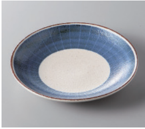
291-11-57H 500円 パウム16cmプレート 16.2×3cm