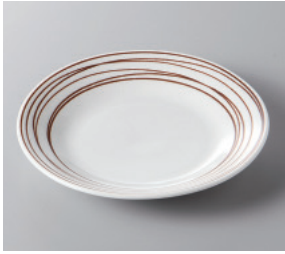
291-9-57H 550円 らいん(ホワイト)16cmプレート 16×2.5cm