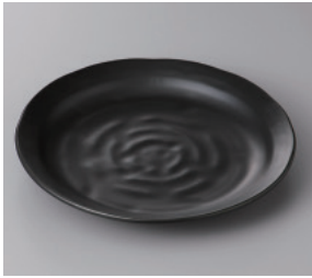
291-16-31H 480円 黒マツ 6.0皿 19×2.6cm