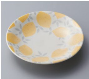
291-27-75H 500円 レモン 5.0皿 16.5×3cm