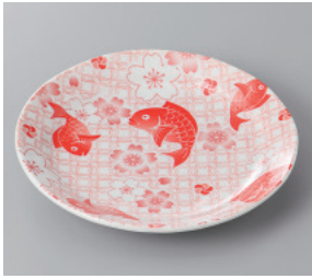
291-33-30H 360円 目出鯛 5.0皿 16.5×2.5cm