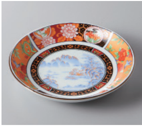
291-17-10H 1,000円 金彩伊万里丸 4.0皿 14.1×2.5cm 291-18-10H 840円 金彩伊万里丸 3.5皿 12×2.5cm