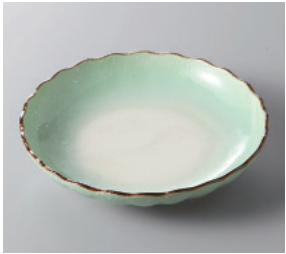
291-3-78H 560円 小雪緑菊型 5.0皿 16.3×3.5cm 291-4-78H 460円 小雪緑菊型 4.0皿 13.7×3cm