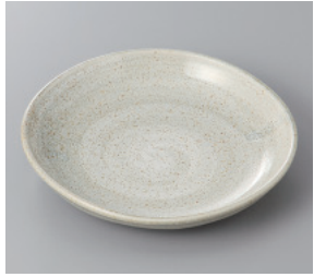
291-8-35H 550円 粉引剛毛深口 5.5皿 17×3.2cm