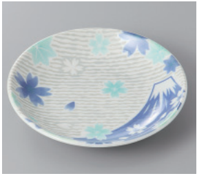
291-31-30H 360円 世界遺産富士 5.0皿(青) 16×3cm