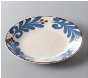
291-26-31H 430円 琉球三味草吹き反型 5.0皿 16×2.2cm