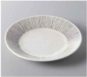
291-21-31H 430円 プラン反型 5.0皿 16×2.4cm