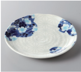
291-22-22H 420円 麻の葉桜 5.0皿 16.3×1.9cm