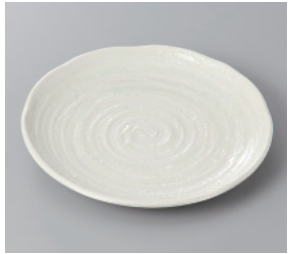
291-19-32H 440円 吉祥粉引渦巻 5.0皿 16.5×1.8cm