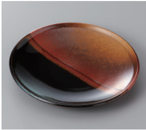
291-2-26H 550円 あげぼの天目 5.0皿 16.5×2cm