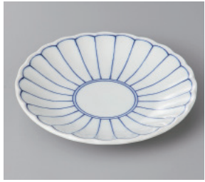
291-29-34H 380円 菊花紋 4.5皿 15.3×2.3cm