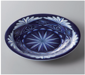
291-15-27H 450円 江戸切子 5.0皿 16.5×2.3cm