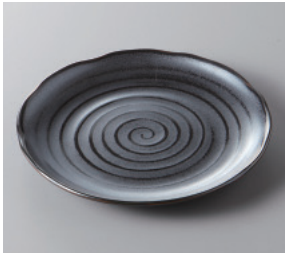
291-20-57H 400円 鉄結晶 5.0皿 16.5×2cm