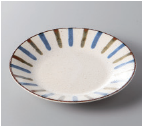
291-25-31H 430円 琉球三味草反型 5.0皿 16×2.2cm