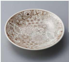
291-28-75H 500円 ブロッサム 5.0皿 16.5×3cm