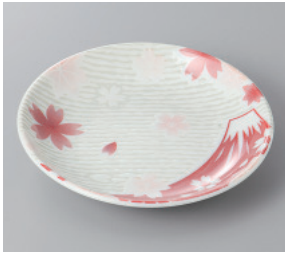
291-30-30H 360円 世界遺産富士 5.0皿(赤) 16×3cm