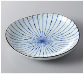
291-14-36H 480円 吹墨十草三角 5.0皿 16.5×3.2cm