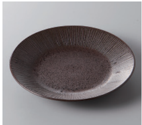
291-24-31H 430円 ノワール反型 5.0皿 16×2.4cm