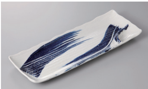
266-14-1H 1,550円 粉引ゴス刷毛仕切皿 31.6×12×1.7cm