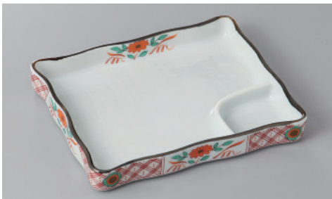
266-8-51H 1,850円 七宝菊仕切皿 17.5×14.2×2.5cm