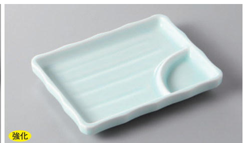
266-17-79H 1,450円 青白磁7.0長角仕切皿 18.5×12.9×2.3cm