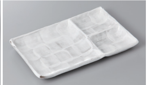
266-6-71H 1,900円 うのふ仕切皿 23.8×14.5×2.2cm