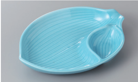
266-4-77H 2,000円 トロコ葉形仕切皿 23.3×16.3×4cm