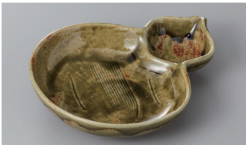
266-7-10H 1,900円 織部ライン流しひさご仕切皿 20.5×16.2×3.7cm