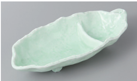
266-13-33H 1,730円 もえぎハーモニー鉢 22×10cm