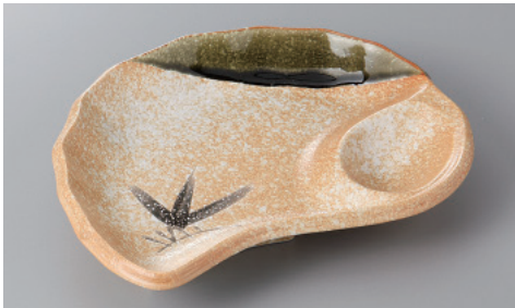
266-11-21H 1,600円 石焼織部笹雲型仕切皿 22×17×4cm