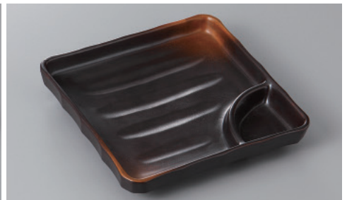
266-9-77H 1,650円 焼締め正角仕切り皿 16.7×16.7×3cm