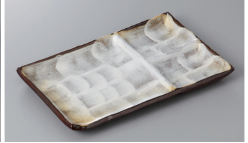
266-3-71H 2,100円 備前志野仕切皿 23.5×14.5cm