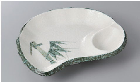
266-10-21H 1,600円 グリーン淡雪雲型仕切皿 22×17×4cm