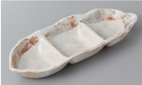
266-5-71H 2,000円 志野たたきそら豆三品皿 27.3×9.6×4cm