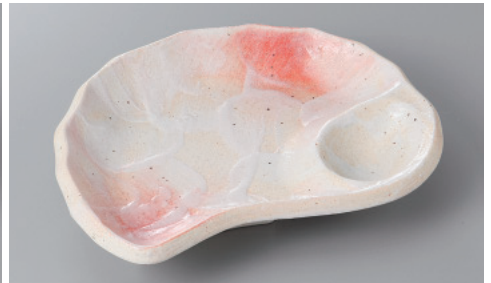
266-12-60H 1,600円 桜志野貝型仕切皿 22×17×4cm