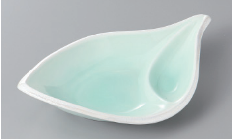
266-2-27H 2,500円 淵ラスター・ヒョ吹ーフ千代久付鉢 23×13.5×4.5cm