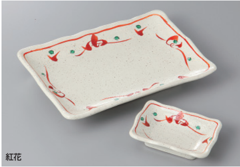
紅花 263-7-21H 1,800円 7.0焼物皿 21.4×14.5×3cm 263-8-21H 860円 千代口 10×7.2×3cm