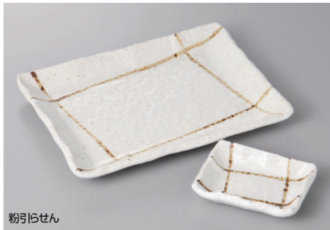
粉引らせん 263-23-79H 2,300円 9.0長角皿 25.6×15.9×2.5cm 263-24-79H 1,700円 8.0長角皿 21.5×16.2×2cm 263-25-79H 1,400円 7.0長角皿 20.3×14.4×2cm 263-26-79H 480円 長角小皿 9.7×7.5×2cm