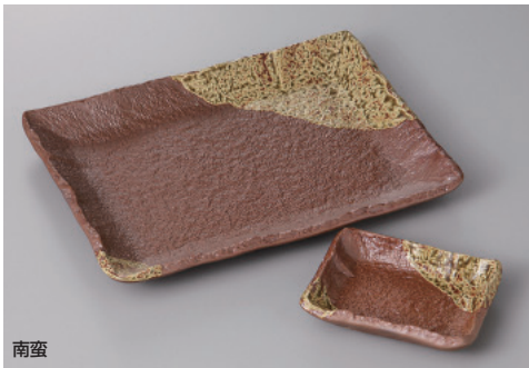
南蛮 263-19-71H 2,400円 9.0長角皿 27×16.2×2.3cm 263-20-71H 1,850円 8.0長角皿 22×16.5×2.2cm 263-21-71H 1,500円 7.0長角皿 20.5×14.3×2cm 263-22-71H 480円 長角小皿 9.6×7.4×1.8cm