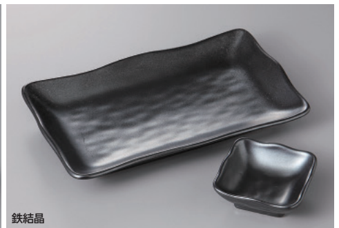
鉄結晶 263-37-26H 1,600円 波角長皿大 25×15×3.5cm 263-38-26H 1,400円 波角長皿中 21×13×3cm 263-39-26H 500円 正角千代口 8.3×3cm