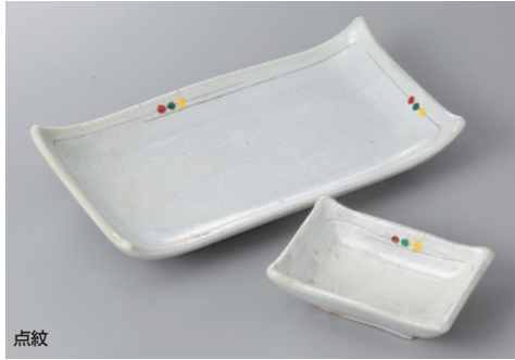
点紋 263-9-45H 1,650円 焼物皿細 21.8×12×3.7cm 263-10-45H 1,100円 角千代口 10.5×7×3.5cm