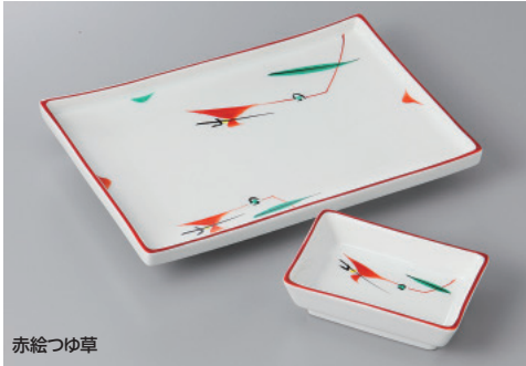
赤絵つゆ草 263-13-73H 1,540円 焼物皿 20.6×14×3cm 263-14-73H 580円 角千代口 9.5×6.5×3cm