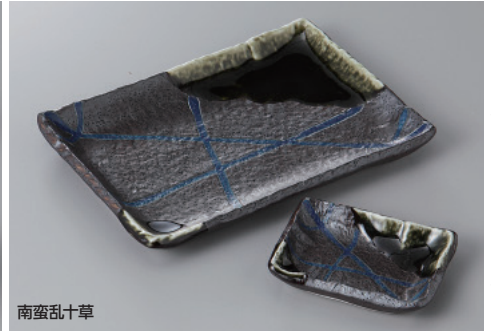
南蛮乱十草 263-11-79H 1,560円 7.0焼物皿 20.3×14×2.3cm 263-12-79H 510円 小皿 9.5×7.2×2.3cm