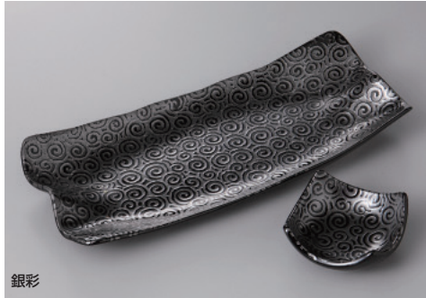
銀彩 263-15-1H 1,500円 焼物皿 27.5×12.3×3.5cm 263-16-1H 550円 小付 7.8×3.5cm