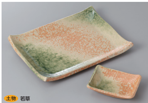
土物 若草 263-34-77H 1,950円 8.0焼物皿 21×15cm 263-35-77H 1,150円 7.0焼物皿 18.5×12.5cm 263-36-77H 650円 長角小皿 9.2×6.7cm