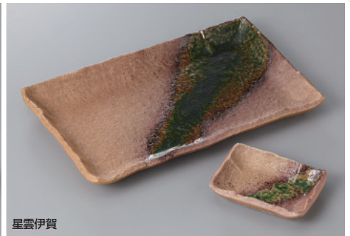
星雲伊賀 263-27-71H 2,400円 9.0長角皿 26.7×16.3×2.4cm 263-28-71H 1,850円 8.0長角皿 21.5×16.5×2.2cm 263-29-71H 1,500円 7.0長角皿 20.7×14.5×2.2cm 263-30-71H 480円 長角小皿 10×7.5×2cm