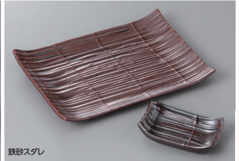
鉄砂スタル 263-17-73H 1,400円 焼物皿 20×14×2cm 263-18-73H 550円 角千代口 8.3×6×2cm