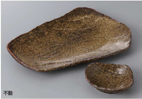
不動 263-1-51H 1,850円 焼物皿 25×17×3cm 263-2-51H 620円 千代口 9.6×8.5×3.5cm