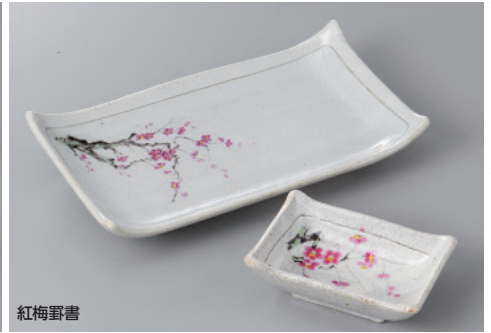
紅梅霏書 263-5-23H 2,100円 焼物皿 22×12×4cm 263-6-23H 1,400円 千代口 10×7×3.5cm