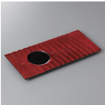
210-15-22H 3,400円 紅黒炭カッパ置長皿 26.5×12.3×1.7cm