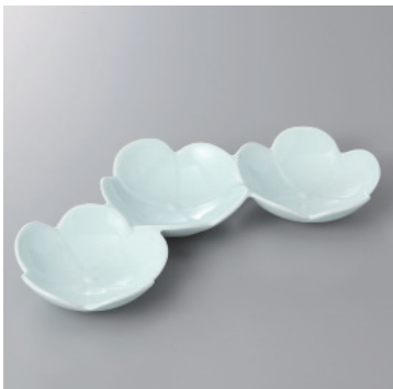
210-19-93H 3,500円 有田焼 花つなぎ (青磁)プレート 1入 28.5×14×3.5cm