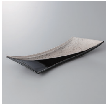
210-18-24H 3,500円 黒プラチナ剣先長皿 35×7.5×4cm