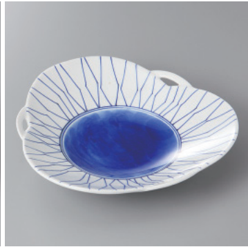
210-2-2H 3,600円 手描ゴス前菜皿 20×20×4.3cm