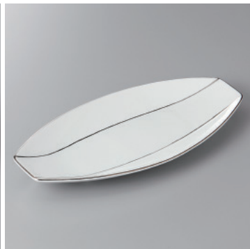
210-14-48H 3,500円 白釉プラチナ9.0皿 27.7×12.6×2cm