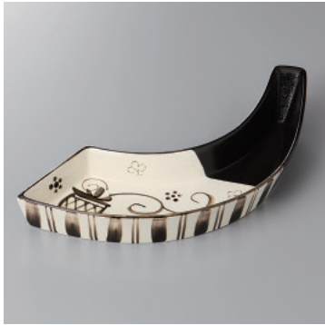
210-4-52H 3,500円 黒織部ひねり前菜皿 30×9×4.5cm