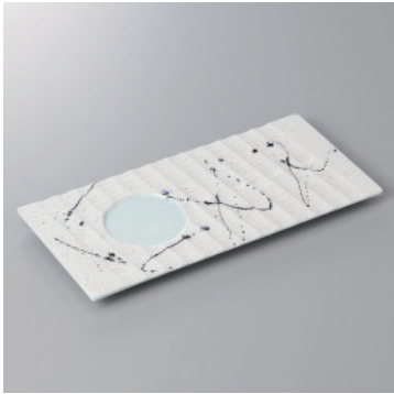
210-3-35H 3,600円 黒飛ばしラスター青磁長角前菜皿 26.7×12.3×1.5cm