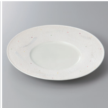
210-6-24H 3,900円 点紋彫入8.0皿 24.7×2.8cm