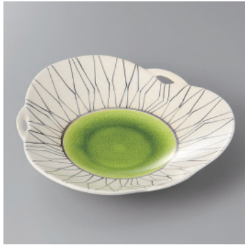
210-1-2H 3,600円 手描グリーン釉前菜皿 20×20×4.3cm