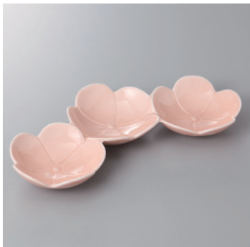
210-20-93H 3,500円 有田焼 花つなぎ (桃釉)プレート 1入 28.5×14×3.5cm