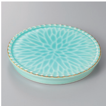
210-16-57H 3,350円 淵錆マリンプルー菊彫高台丸皿 17.4×2cm