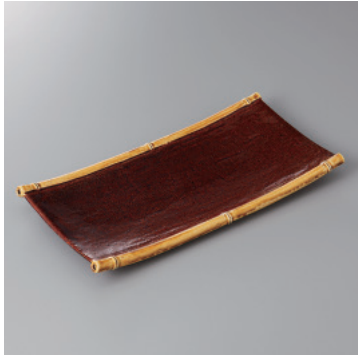
210-12-23H 4,000円 竹淵長前菜皿 27.8×13.3×2.4cm