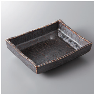
210-13-27H 3,360円 孔雀切立長角鉢 19×15.5×4.5cm