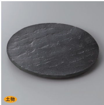
210-8-1H 3,500円 黒陶板石目四足7.0皿 21×2cm