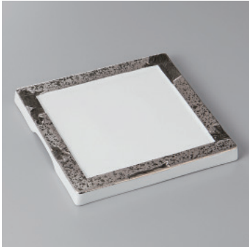
210-11-22H 3,400円 淵プラチナ正角皿 18×17×1.8cm