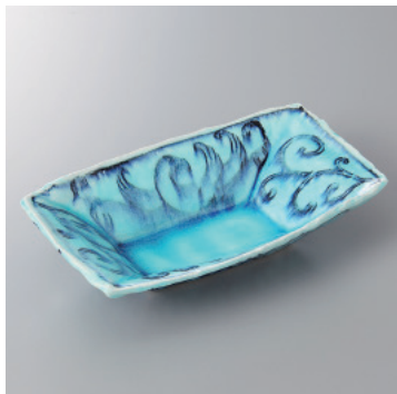
210-17-23H 3,600円 湖水精白長角盛鉢 21.6×12.7×4.5cm