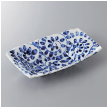
210-7-23H 4,000円 手描タコ唐草長角盛鉢 21.6×12.7×4.5cm