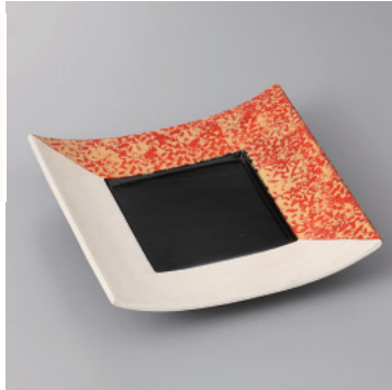
210-9-35H 3,400円 赤半掛正角皿 16.7×16.7×3.8cm