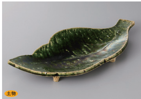
206-5-2H 6,000円 織部モミジ皿 18×18.5×3.5cm