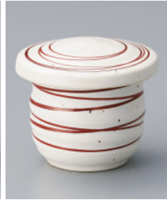
202-12-34H 1,200円 手描き赤絵ラセン豆むし碗 6.5×6.8cm 100cc