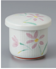
202-8-32H 890円 白磁かおり小むし 6.3×6.5cm 120cc