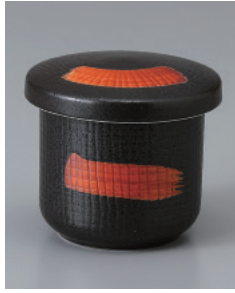
202-10-32H 840円 黒赤ハケメミニむし碗 6.3×6.5cm 120cc