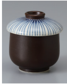
202-5-71H 1,250円 南蛮青十草小蒸し碗 7×8cm 150cc