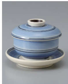
202-18-71H 1,300円 太駒筋(青)ミニ蒸し碗 7×6.2cm 120cc