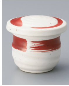
202-11-34H 1,200円 手描き赤絵ハケメ豆むし碗 6.5×6.8cm 100cc