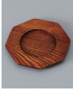
202-43-90H 400円 木受台(大) φ5.5(10×10)cm