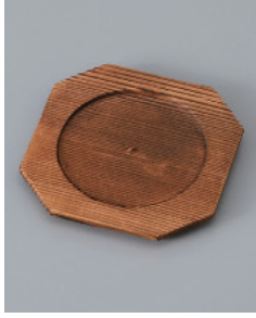
202-42-90H 340円 むし碗受台(並) φ6(10×10)cm