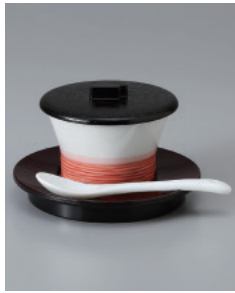
202-30-77H 1,480円 杵型赤巻蒸し碗(小) 8.8×6cm 120cc