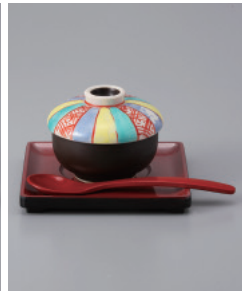
202-36-71H 1,700円 紙風船ミニむし碗 6.8×6.2cm