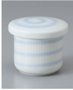
202-9-32-48H 820円 白磁布目渦小むし 6.3×6.5cm 120cc