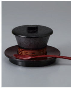
202-27-77H 1,480円 杵型茶蒸し碗(小) 8.8×6cm 120cc