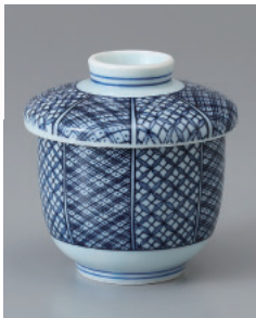
202-13-2H 1,250円 青白磁祥瑞むし碗 7.5×8.7cm