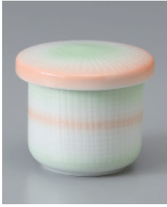
202-7-32H 980円 白磁二色吹小むし 6.3×6.5cm 120cc