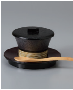
202-24-77H 1,480円 杵型伊羅保蒸し碗(小) 8.8×6cm 120cc