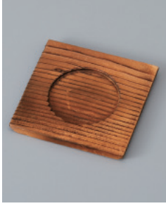
202-39-90H 270円 焼杉受台(並)10cm φ6(10×10)cm