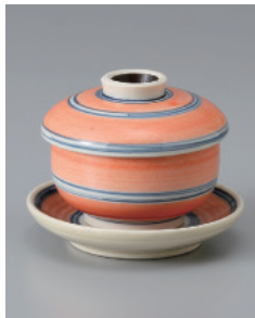
202-16-71H 1,300円 太駒筋(ピンク)ミニ蒸し碗 7×6.2cm 120cc