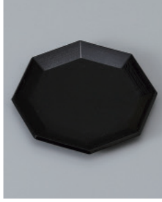
202-44-90H 350円 (P)正八角受台 9×9cm