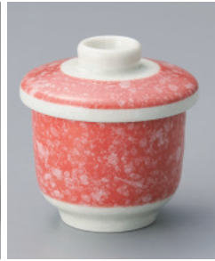
202-6-25H 850円 翔鳳(赤)蒸し碗(小) 7.5×8cm