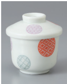
202-14-71H 1,200円 源氏丸紋蒸し碗 7.4×8.3cm 170cc