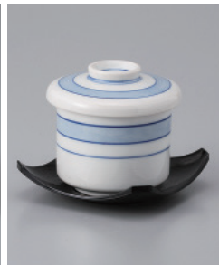
202-20-77H 800円 紺ラインむし碗(小) 7×8cm