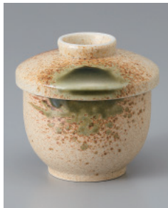
202-15-77H 1,650円 伊賀織部蒸し碗(小) 7.5×8.2cm 200cc