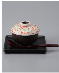
202-33-71H 1,700円 赤絵唐草ミニむし碗 6.8×6.2cm