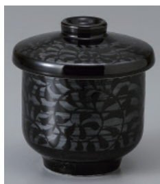
200-26-34H 780円 黒渦唐草むし碗 6.7×8.2cm 130cc