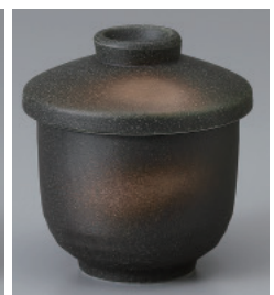
200-30-23H 830円 黒伊賀小むし碗 7×8.8cm