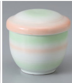
200-22-77H 1,100円 白磁二色吹蒸し碗(中) 7.4×7.4cm 150cc