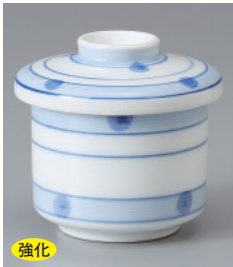
強化 200-19-79H 1,220円 ダミラインむし碗 6.8×7.8cm 150cc