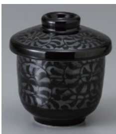
200-25-32H 780円 小むし黒釉唐草模様 6.9×8.2cm 200cc