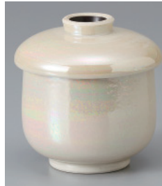
200-3-71H 1,650円 ラスター小蒸し碗 6.9×8cm