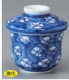
強化 200-8-71H 1,750円 梅づくし小蒸し碗 7.2×8.3cm