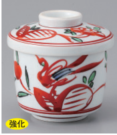
強化 200-7-7H 2,800円 赤絵小むし碗 6.7×7.5cm 135cc