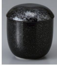
200-33-1H 950円 黒唐草小むし碗 15入 7.3×8.5cm 190cc