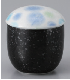
200-31-1H 960円 靑化粧小むし碗 15入 7.3×8.5cm 190cc