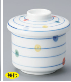
強化 200-11-78H 1,270円 四色水玉むし碗 6.8×7.8cm 150cc