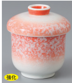
強化 200-2-77H 1,980円 赤白タタキ蒸し碗(小) 6.5×8.5cm 150cc