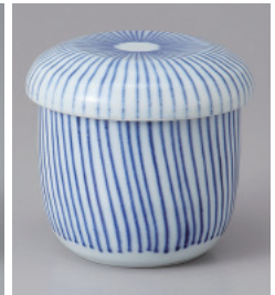
200-24-35H 850円 細十草むし碗 7.5×8cm 230cc