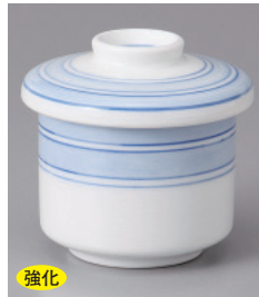
強化 200-21-79H 1,060円 駒筋むし碗 6.8×7.5cm 150cc