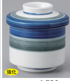
強化 200-16-71H 1,530円 二色ライン蒸し碗 7×8.5cm 145cc