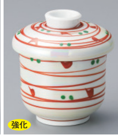
強化 200-10-77H 1,800円 パールらせん蒸し碗(小) 6.5×8.5cm 150cc