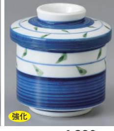
強化 200-17-79H 1,390円 花つなぎむし碗 6.7×8cm 150cc