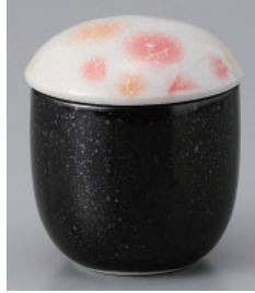
200-32-1H 960円 赤化粧小むし碗 15入 7.3×8.5cm 190cc