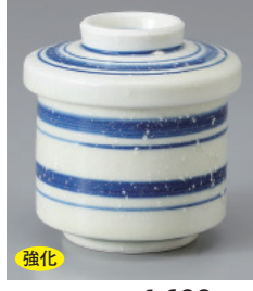
強化 200-14-77H 1,600円 ぼたん釉駒筋蒸し碗(小) 7.8×8cm 150cc