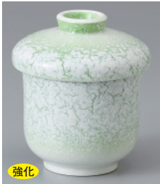
強化 200-1-77H 1,980円 白タタキ蒸し碗(小) 6.5×8.5cm 150cc