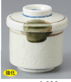
強化 200-13-77H 1,600円 織部茶筋蒸し碗(小) 7.8×8cm 150cc