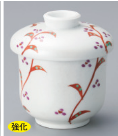
強化 200-4-77H 2,100円 紫式部蒸し碗(小) 6.5×8.5cm 150cc