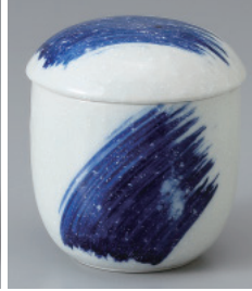
200-34-1H 950円 粉引ゴス刷毛むし碗 15入 7.3×8.5cm 170cc