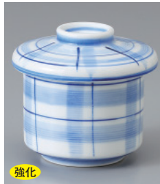
強化 200-20-78H 1,220円 格子蒸し碗 6.8×7.8cm 150cc