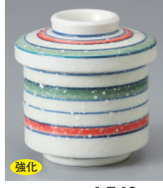
強化 200-15-73H 1,540円 新雪駒筋小型むし碗 6.8×8cm 150cc