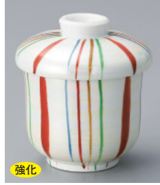
強化 200-9-77H 1,800円 パール十草蒸し碗(小) 6.5×8.5cm 150cc