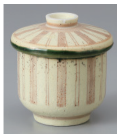
200-27-34H 780円 織部豆むし碗 6.7×8.2cm 130cc