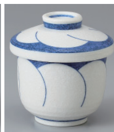
200-29-23H 790円 淡雪梅割小むし碗 7×8.8cm