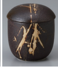
200-35-6H 880円 黒結晶ミニむし碗 7.5×8cm 150cc