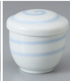
200-23-32H 1,030円 白磁渦中むし 7.5×7.5cm