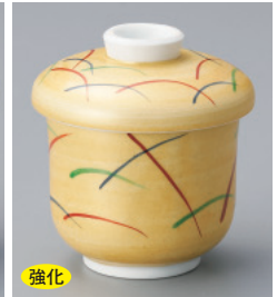
強化 200-6-77H 1,800円 金彩武蔵野蒸し碗(小) 6.5×8.5cm 150cc