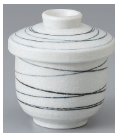
200-28-71・34H 680円 淡雪ライン小蒸し碗 7.5×8.7cm