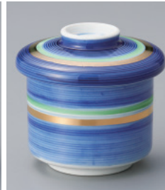
200-5-77H 1,200円 紺地駒筋蒸し碗 7×8cm