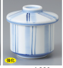
強化 200-18-71H 1,220円 親子十草蒸し碗 6.8×7.8cm 150cc