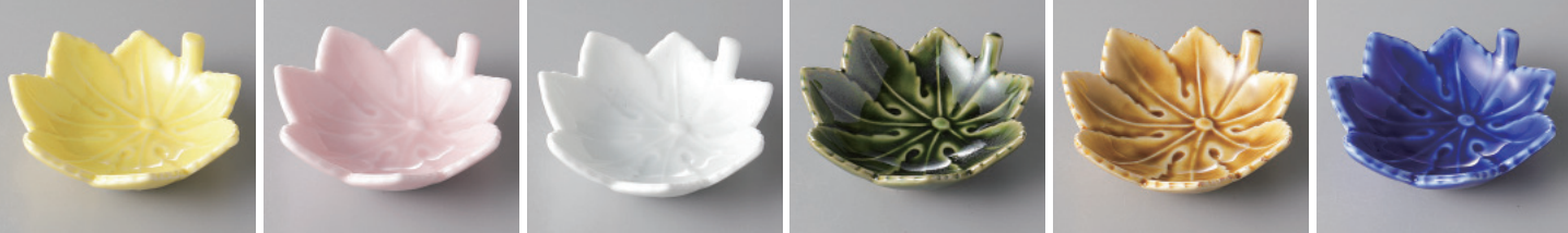
164-37-71H 320円 モミジ(黄色)珍味 8.2×7.5×2.5cm 164-38-71H 320円 モミジ(ピンク)珍味 8.2×7.5×2.5cm 164-39-71H 320円 モミジ(白)珍味 8.2×7.5×2.5cm 164-40-71H 360円 織部紅葉珍味 8.5×7.5×2.3cm 164-41-71H 360円 黄瀬戸紅葉珍味 8.5×7.5×2.3cm 164-42-71H 320円 モミジ(ルリ)珍味 8.2×7.5×2.5cm