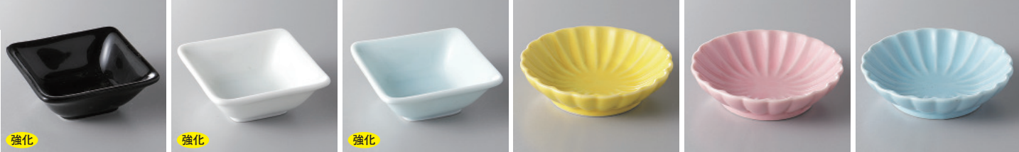
164-7-71H 360円 スワンブラック角珍味 7×7×2.6cm 164-8-71H 360円 スワン白磁角珍味 7×7×2.6cm 164-9-71H 360円 スワン青磁角珍味 7×7×2.6cm 164-10-48H 340円 イエロー菊型豆小皿 7.8×2cm 164-11-48H 340円 ピンク菊型豆小皿 7.8×2cm 164-12-48H 340円 ブルー菊型豆小皿 7.8×2cm