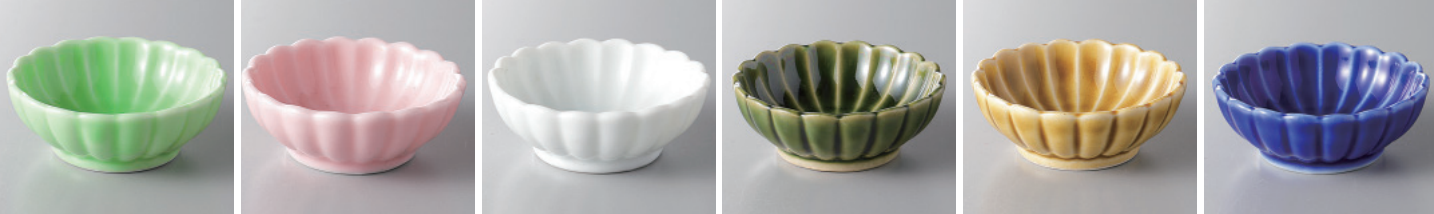
164-31-71H 290円 グリーン菊豆珍味 6.1×2.2cm 164-32-71H 290円 ピンク菊豆珍味 6.1×2.2cm 164-33-71H 290円 ホワイト菊豆珍味 6.1×2.2cm 164-34-71H 330円 織部菊型珍味 6.4×2.3cm 164-35-71H 330円 黄瀬戸菊型珍味 6.4×2.3cm 164-36-71H 290円 ルリ菊豆珍味 6.1×2.2cm