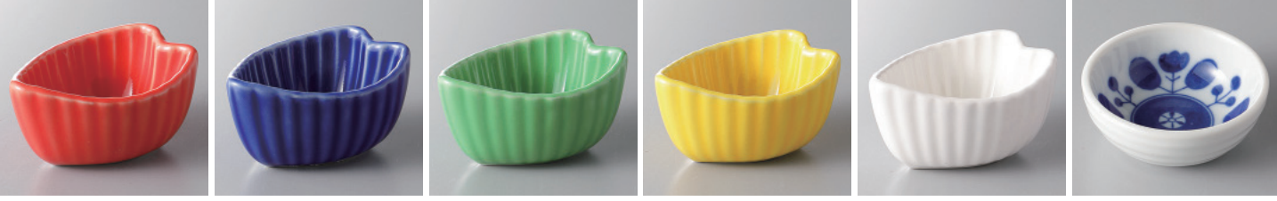
164-19-2H 350円 花びら珍味ピンク 6×4.5×3.1cm 164-20-2H 350円 花びら珍味ブルー 6×4.5×3.1cm 164-21-2H 350円 花びら珍味ヒワ 6×4.5×3.1cm 164-22-2H 350円 花びら珍味黄 6×4.5×3.1cm 164-23-2H 350円 花びら珍味白 6×4.5×3.1cm 164-24-77H 300円 ひまわり深豆皿 6.2×2.6cm