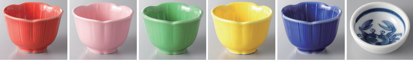
164-25-2H 330円 花珍味ピンク 5.7×3.6cm 164-26-27H 330円 キティーピンク花珍味 5.5×3.7cm 164-27-77-2H 330円 グリーンキキョウ珍味 5.5×3.5cm 164-28-77-2H 330円 黄キキョウ珍味 5.5×3.5cm 164-29-77H 330円 ブルーキキョウ珍味 5.5×3.5cm 164-30-77H 300円 カニ深豆皿 6.2×2.6cm