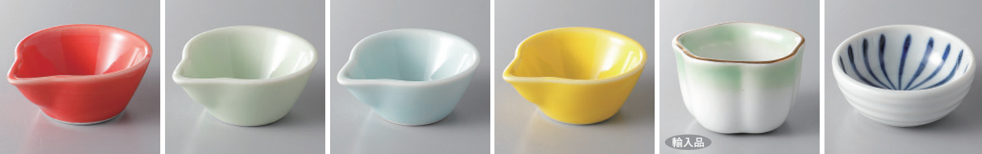
164-13-2H 430円 片口色珍味(赤) 6×5×2.2cm 164-14-2H 430円 片口色珍味(ヒワ) 6×5×2.2cm 164-15-2H 430円 片口色珍味(青磁) 6×5×2.2cm 164-16-2H 430円 片口色珍味(黄) 6×5×2.2cm 164-17-45H 330円 ヒワ吹測金梅型小付 ミニ 3.6×2.3cm 164-18-77H 300円 太十草深豆皿 6.2×2.6cm