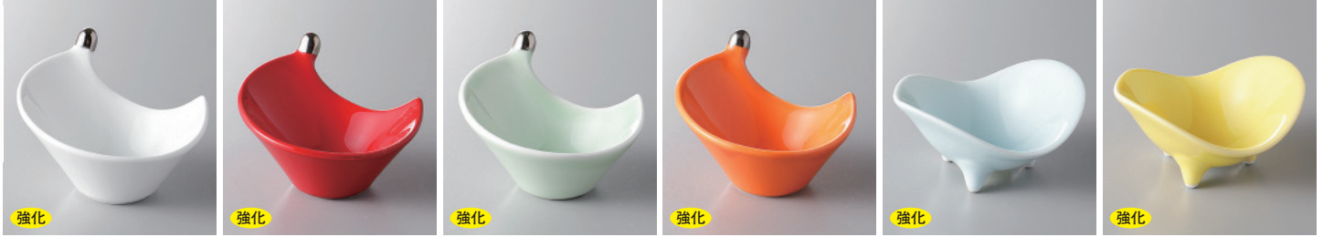
160-7-33H 1,200円 ホワイト栗珍味 7.5×5.7×4.5cm 160-8-33H 1,200円 レッド栗珍味 7.5×5.7×4.5cm 160-9-33H 1,200円 ヒョウ栗珍味 7.5×5.7×4.5cm 160-10-33H 1,200円 オレンジ栗珍味 7.5×5.7×4.5cm 160-11-71H 860円 青白磁ミツ足珍味 8×7×3.8cm 160-12-73H 860円 イエローミツ足珍味 8×7×3.8cm