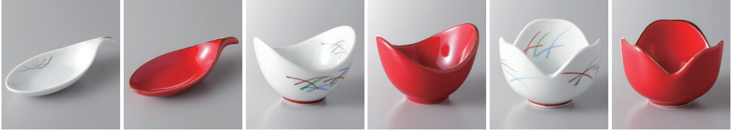
160-19-41H 780円 武蔵野木の葉型珍味 12×4.7×3cm 160-20-41H 720円 赤釉淵金木の葉型珍味 12×4.7×3cm 160-21-41H 820円 武蔵野舟形珍味 8.4×6.9×5.2cm 160-22-41H 760円 赤釉淵金舟形珍味 8.4×6.9×5.2cm 160-23-41H 780円 武蔵野割山椒珍味 6.4×4.1cm 160-24-41H 720円 赤釉淵金割山椒珍味 6.4×4.1cm