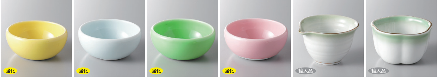
160-25-71H 700円 黄丸千代口 7.3×3.2cm 160-26-71-73H 700円 青白磁丸千代口 7.3×3cm 160-27-71H 700円 グリーン丸千代口 7.3×3.2cm 160-28-73H 700円 ピンク丸珍味 7.3×3.2cm 160-29-45H 750円 ヒョウ吹淵金片口珍味(大) 8.4×7.6×5.4cm 160-30-45H 850円 ヒョウ吹淵金梅小付(中) 7.5×7.5×4.5cm