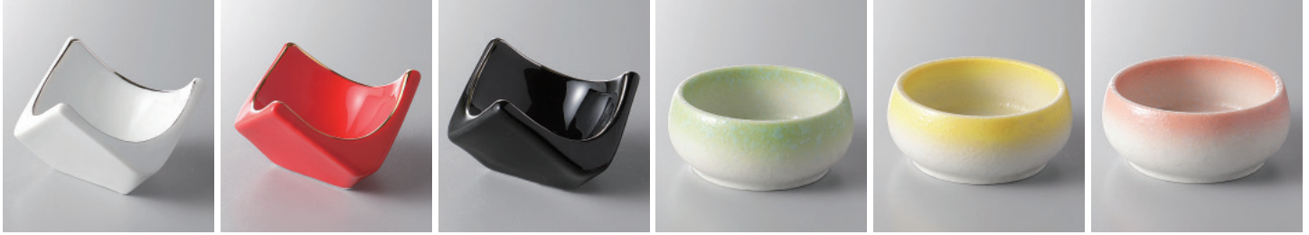
160-13-35H 1,050円 白磁プラチナ三角小付 8.2×8.2×4.7cm 160-14-35H 1,050円 赤釉金線三角小付 8.2×8.2×4.7cm 160-15-35H 1,050円 黒釉プラチナ三角小付 8.2×8.2×4.7cm 160-16-57H 720円 ヒョウ吹丸珍味 7.2×3cm 160-17-57H 720円 イエロー吹丸珍味 7.2×3cm 160-18-57H 720円 ピンク吹丸千代口 7.2×3cm