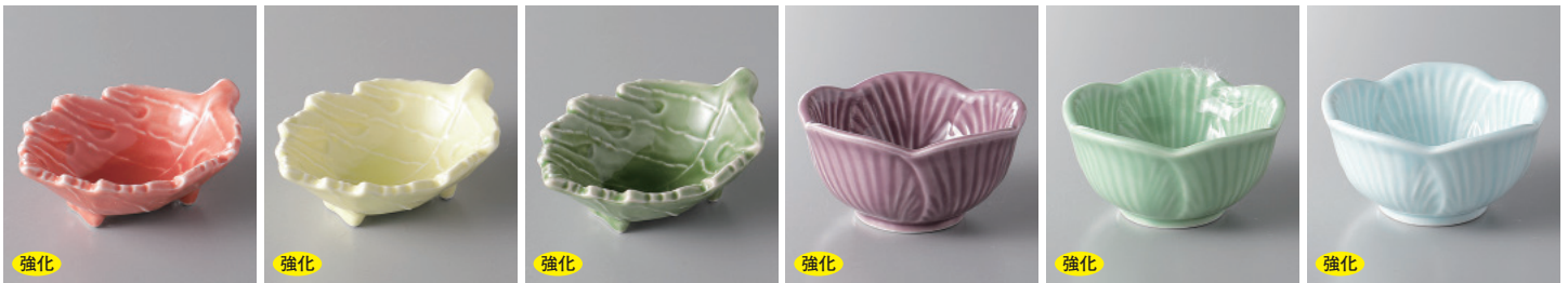
160-31-5H 1,110円 桃釉木の葉珍味 8.7×5.5×3.4cm 160-32-5H 1,110円 黄木の葉珍味 8.7×5.5×3.4cm 160-33-5H 990円 天竜青磁木の葉珍味 8.7×5.5×3.4cm 160-34-78H 720円 木の葉型珍味 パープル 6.6×3.5cm 160-35-71H 720円 木の葉型珍味 グリーン 6.6×3.5cm 160-36-79H 720円 木の葉型珍味 ライトブルー 6.6×3.5cm