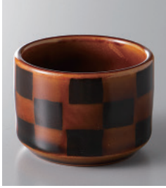
159-7-48H 300円 茶市松切立珍味 5.3×3.8cm