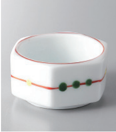
159-14-71H 660円 こま筋六角珍味 6.3×5.8×3cm