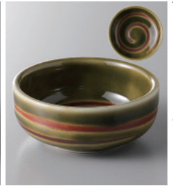
159-6-1H 250円 織部濁切立小皿 6.8×2.9cm