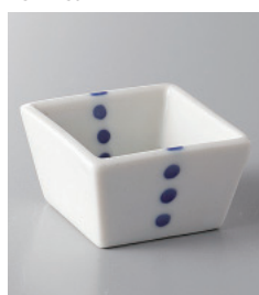
159-35-71H 720円 ブチド小正角ミニ珍味 4×4×2.3cm