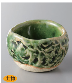
159-27-48-45H 720円 ツボ型織部珍味(手造) 4×3cm