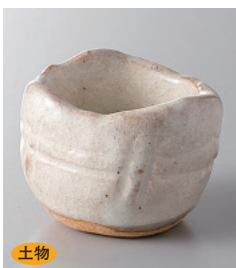
159-25-45H 720円 粉引小丸珍味(手造) 4.3×4×3cm