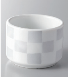
159-8-48H 300円 白市松切立珍味 5.3×3.8cm