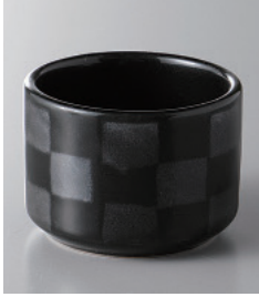
159-9-48H 300円 黒市松切立珍味 5.3×3.8cm