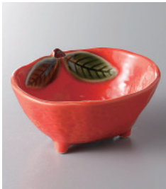
159-21-33H 600円 朱赤ゆず珍味 9×7.5×4cm