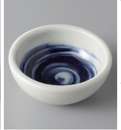
159-18-32H 250円 呉須うずこつぶ 6×2.5cm