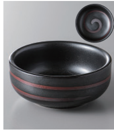
159-5-1H 250円 黒濁切立小皿 6.8×2.9cm