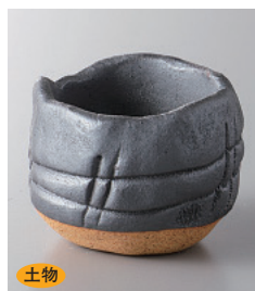
159-29-45H 720円 鉄釉小丸珍味(手造) 4.3×4×3cm