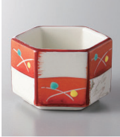
159-15-71H 800円 赤絵市松六角豆鉢 4.3×3.3cm