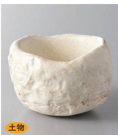
159-26-48H 720円 ツボ型白釉珍味(手造) 4×3cm