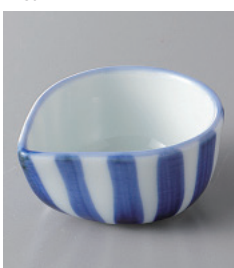
159-33-71H 720円 太十草片口ミニ珍味 5.5×4.5×2.5cm