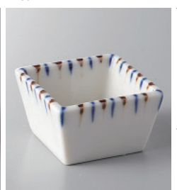
159-36-71H 720円 瀧二色十草正角ミニ珍味 4×4×2.3cm