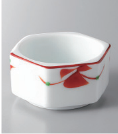
159-13-71H 660円 赤絵唐草六角珍味 6.4×3cm