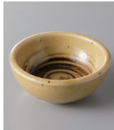
159-23-34H 250円 黄釉こつぶ珍味 6.3×2.6cm