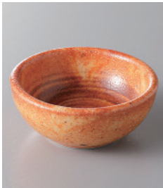
159-22-34H 250円 赤志野こつぶ珍味 6.3×2.6cm