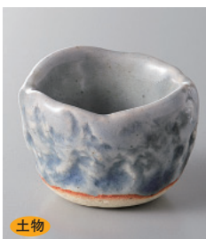
159-28-48H 720円 ツボ型藍釉珍味(手造) 4×3cm