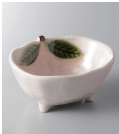
159-19-33H 600円 桜志野ゆず珍味 9×7.5×4cm