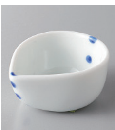
159-31-71H 720円 ブチド小片口ミニ珍味 5.5×4.5×2.5cm