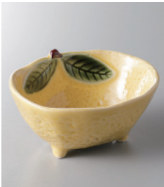
159-20-33H 600円 黄茶ゆず珍味 9×7.5×4cm