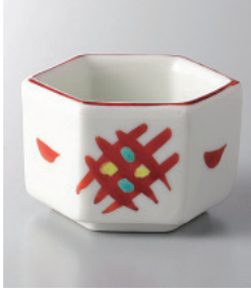
159-16-71H 800円 赤絵格子六角豆鉢 4.3×3.3cm