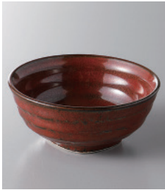
159-3-43H 340円 鉄赤釉膳めぐり小付 8×3.4cm