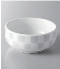
159-1-32H 300円 白市松丸珍味 7.7×3.2cm