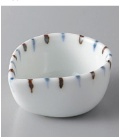
159-32-71H 720円 瀧二色十草片口ミニ珍味 5.5×4.5×2.5cm