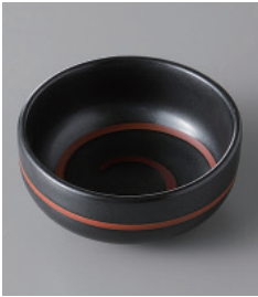
159-2-32H 320円 黒丸うず珍味(大) 7.5×3.2cm