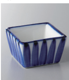
159-34-71H 720円 太十草正角ミニ珍味 4×4×2.3cm