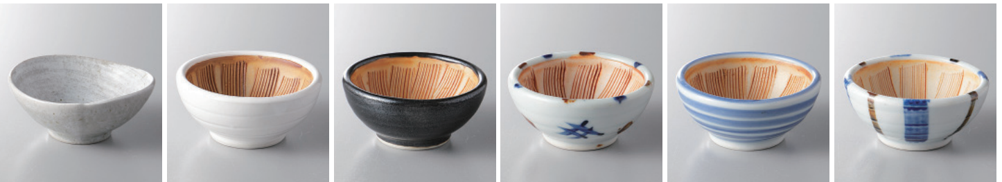
158-13-56H 430円 青地刷毛珍味 7×7×3cm 158-14-79H 430円 白ミニリ鉢珍味 6×2.8cm 158-15-79H 430円 黒ミニリ鉢珍味 6×2.8cm 158-16-71H 450円 格子摺鉢型珍味 6.2×2.5cm 158-17-71H 450円 ゴス渦摺鉢形珍味 6.2×2.5cm 158-18-71H 450円 二色筋摺鉢型珍味 6.2×2.5cm