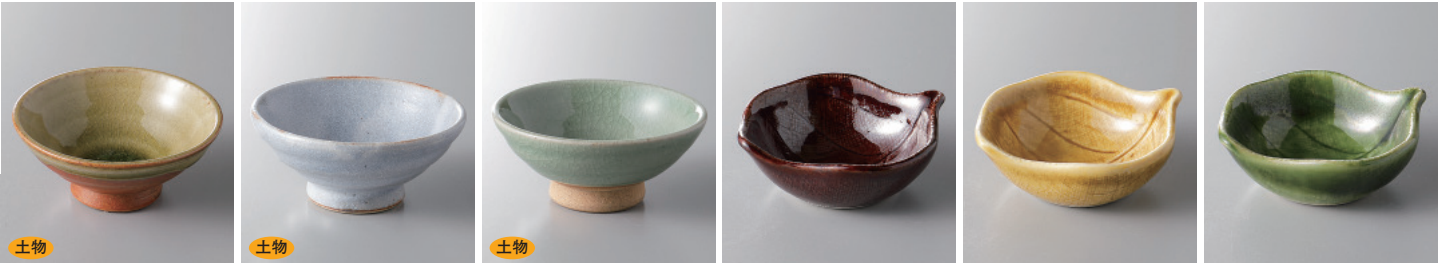
158-7-45H 450円 唐津平珍味 7.8×3.5cm 158-8-45H 450円 平珍味ネズ志野 7.8×3.5cm 158-9-45H 450円 青磁貫入平珍味 7.8×3.5cm 158-10-71H 320円 鉛木の葉豆鉢 8.5×7.7×3cm 158-11-71H 320円 黄瀬戸木の葉豆鉢 8.5×7.7×3cm 158-12-71H 320円 織部木の葉豆鉢 8.5×7.7×3cm