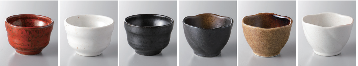
158-1-57H 560円 朱赤珍味 5.8×4cm 158-2-57H 540円 白備前珍味 5.8×4cm 158-3-57H 560円 漆黒珍味 5.8×4cm 158-4-2H 450円 黒備前金茶梅形珍味 6.7×4.7cm 158-5-2H 450円 伊賀おりべ梅形珍味 6.7×4.7cm 158-6-2H 450円 あげぼの梅形珍味 6.7×4.7cm