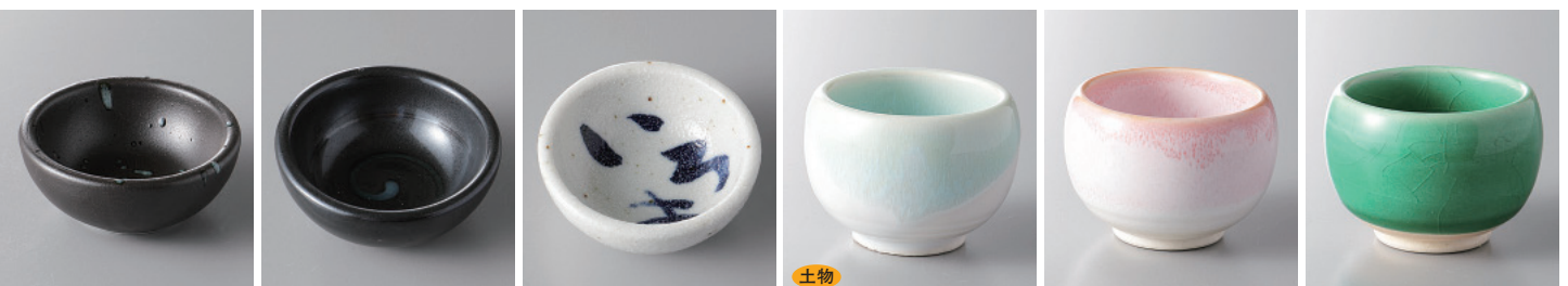
158-19-56H 260円 天目白丸珍味 6×2.5cm 158-20-32H 250円 黒うず小つづ 6×2.5cm 158-21-56H 250円 いろは丸珍味 6×2.5cm 158-22-33H 330円 青流珍味 5.5×4cm 158-23-77H 340円 桜流し珍味 5.3×3.7cm 158-24-77H 340円 グリーン貫入珍味 5.3×3.7cm