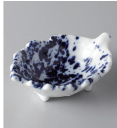
155-6-5H 840円 吹墨木の葉珍味 9×6×3.5cm