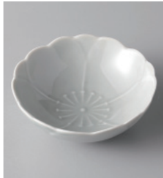
155-3-93H 1,300円 有田焼 さくらコツケ(消曇) 5入 8.5×3cm 50cc