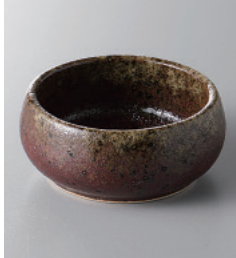
155-20-57H 720円 あずき釉丸千代口 7.2×3cm