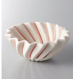
155-9-71H 850円 赤絵筋フルル珍味 7×2.8cm