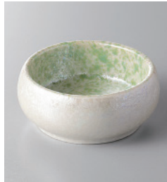
155-5-57H 990円 ヒツしぶきラスター丸千代口 7.2×3cm