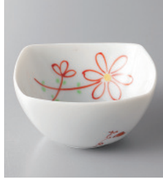
155-35-93H 620円 小菊角姫小付 10入 6.5×3.5cm