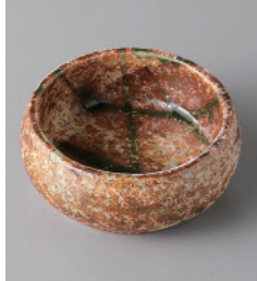
155-21-57H 720円 かいらぎ織部丸珍味 7.2×3cm