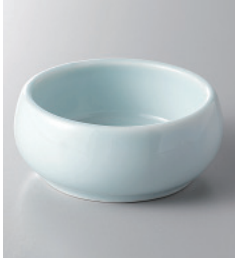
155-22-57H 720円 青磁丸珍味 7.2×3cm