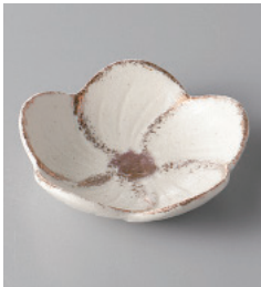
155-13-71H 780円 金たたき梅珍味小皿 6.5×1.5cm