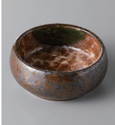
155-19-57H 720円 信楽織部丸千代口 7.2×3cm