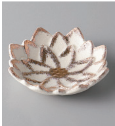
155-14-71H 780円 金たたきダリア珍味小皿 6.5×1.5cm