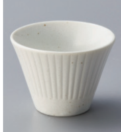
155-11-78H 520円 掬水十草反珍味 7.5×5cm