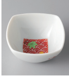
155-33-93H 620円 波もみじ角 姫小付 10入 6.5×3.5cm