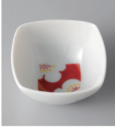
155-34-93H 620円 白梅角 姫小付 10入 6.5×3.5cm