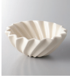
155-27-71H 720円 白フルル珍味 7.5×3cm