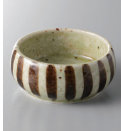
155-23-57H 720円 サビ十草丸珍味 7.2×3cm