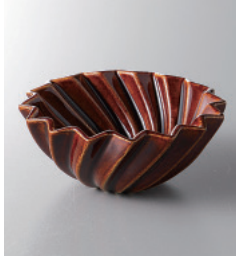
155-26-71H 720円 飴フルル珍味 7.5×3cm