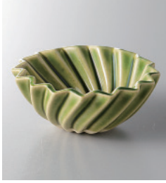
155-25-71H 720円 織部フルル珍味 7.5×3cm