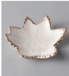
155-15-71H 780円 金たたき紅葉珍味小皿 6.5×1.5cm