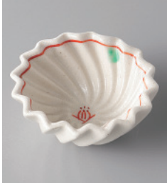
155-10-71H 850円 赤巻フルル珍味 7×2.8cm