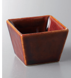
155-12-78H 890円 ア×軸角珍味 4.5×4.5×3.3cm