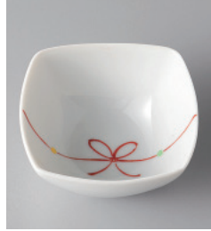
155-36-93H 620円 結び角 姫小付 10入 6.5×3.5cm