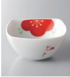
155-32-93H 620円 紅梅角姫小付 10入 6.5×3.5cm