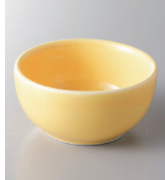
155-24-34H 850円 黄磁丸千代久 6.4×3.1cm