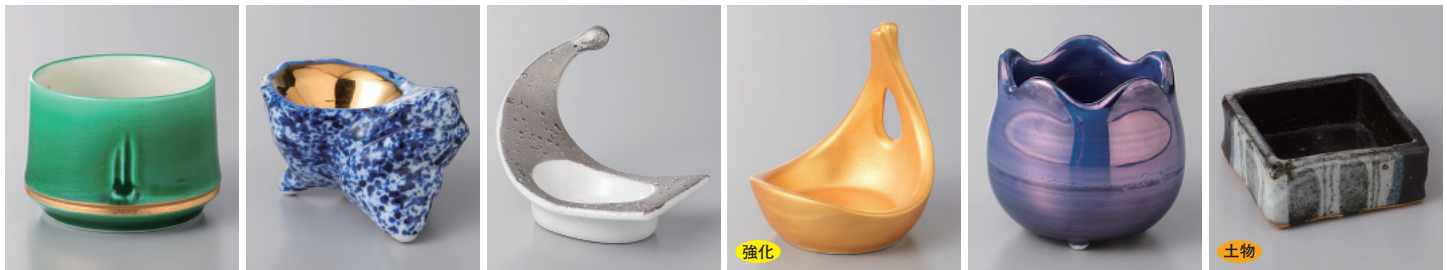
152-1-52H 3,100円 緑交趾竹型小付 6×4.2cm 152-2-34H 2,880円 金彩さざえ珍味 6×5×4cm 152-3-35H 2,600円 プラチナ玉淵レンゲ珍味 9×5.2×6.2cm 強化 152-4-5H 2,700円 金彩手付珍味 6.5×6×7cm 152-5-5H 2,270円 紫パールつぼ小付 5.4×4.4cm 土物 152-6-45H 2,200円 黒織部十草正角切立珍味鉢 手造り 6.5×6.5×2.8cm