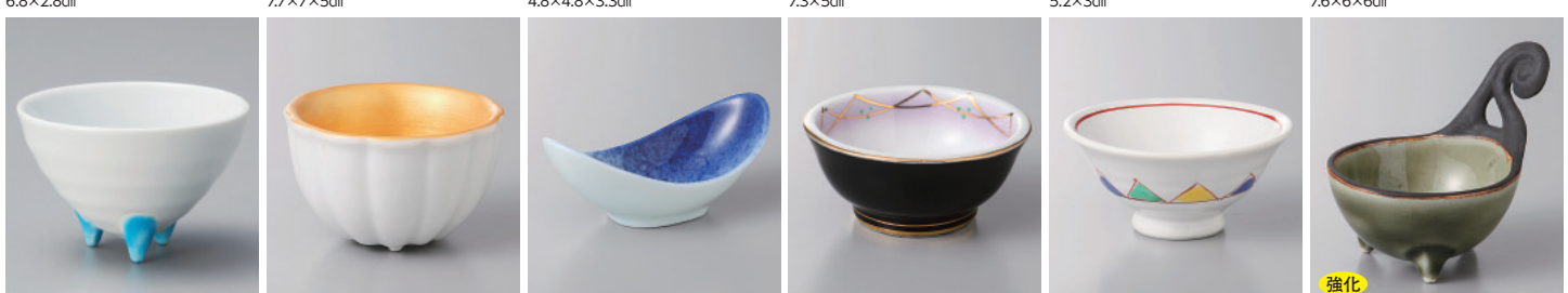
152-19-93H 1,800円 ミツ足ブルー小付 6.8×4.5cm 152-20-5H 1,380円 内金彩菊型千代口(小) 5.2×3cm 152-21-22H 1,150円 吹墨舟型珍味 10.5×5×4.5cm 152-22-51H 1,300円 錦武蔵野千代口 8.5×4cm 152-23-22H 1,300円 白マツ三角紋珍味 7.5×3.5cm 強化 152-24-71H 1,220円 桃山織部びつ型手付珍味 6×6.5cm