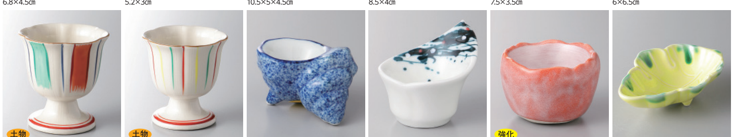
土物 152-25-77H 1,300円 二色十草高台珍味 6.1×6.6cm 土物 152-26-77H 1,300円 色十草高台珍味 6.1×6.6cm 152-27-00H 1,270円 サザエ珍味(小) 6.8×5.8×4cm 152-28-33H 1,200円 モリキー小付 7.5×5.5×5.2cm 強化 152-29-5H 1,200円 内銀赤楽波瀾小付 6.4×4.4cm 152-30-33H 1,200円 黄釉グリーン葉型珍味 10.3×6.7×2.9cm