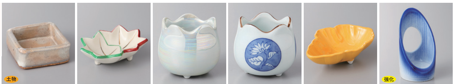
土物 152-7-45H 2,200円 粉引正角切立珍味鉢 手造 6.5×6.5×2.8cm 152-8-5H 1,890円 高麗もみじ皿 9×6.6×2.8cm 152-9-5H 1,820円 内外パールつぼつぼ珍味 4.3×3.7cm 152-10-5H 1,810円 丸紋つぼつぼ 5.4×4.4cm 152-11-27H 2,300円 黄交趾葉形千代久 10.5×7×3cm 強化 152-12-78H 1,770円 吹墨竹筒珍味 4.9×9.5cm