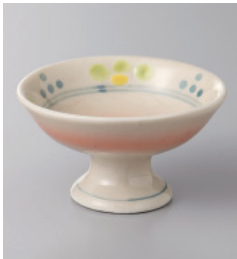
151-33-71H 630円 萩風早春高台珍味 8×4.5cm