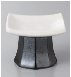
151-24-73H 850円 白マツ高台珍味 5.5×5.5×4.2cm