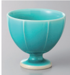
151-7-52H 1,850円 緑彩筋高台珍味 6×5.5cm