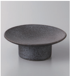
151-17-45H 1,120円 鉄ペーパー高台珍味皿 8×3cm