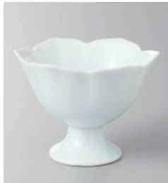
151-13-32H 1,280円 青白磁桔梗型高台珍味 8.8×8.1×6.9cm