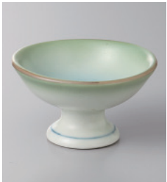
151-34-71H 630円 若草高台珍味 8×4.5cm