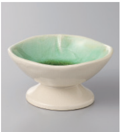
151-29-57H 770円 グリーン高台珍味 8.1×4.1cm