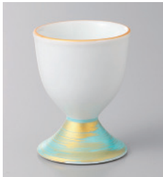
151-14-41H 1,280円 青金彩高台珍味 4.7×6.2cm