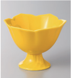
151-11-34H 1,400円 黄彩桔梗高台珍味 9×6.5cm