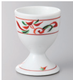
151-25-41H 780円 赤絵唐草高台珍味 4.7×6.2cm