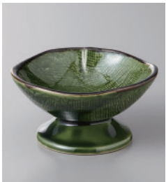
151-28-57H 770円 織部高台珍味 8.1×4.1cm