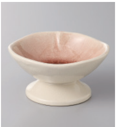
151-30-57H 770円 ワイン高台珍味 8.1×4.1cm