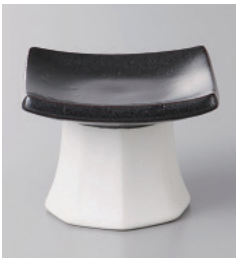
151-23-73H 850円 黒マツ高台珍味 5.5×5.5×4.2cm