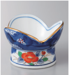
151-6-26H 2,100円 安土牡丹珍味 8.5×6cm