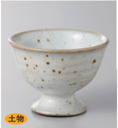
151-12-46H 1,400円 粉引青磁高台珍味 7×5cm