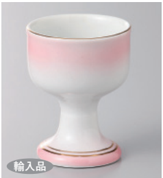
151-36-21H 600円 ピンク吹刺金高台珍味 4.5×5.7cm