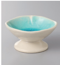
151-31-57H 770円 ブルー高台珍味 8.1×4.1cm