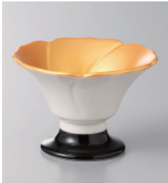
151-3-5H 2,900円 内金花型黒高台珍味 7.6×5.1cm