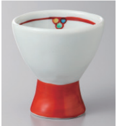
151-10-78H 1,410円 色給高台珍味 6.3×6.8cm