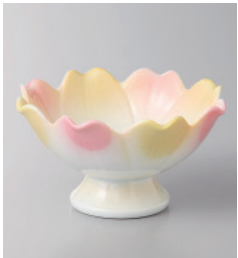
151-16-34H 1,200円 二色吹珍味 9×4.7cm