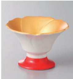
151-2-5H 2,900円 内金花型赤高台珍味 7.6×5.1cm