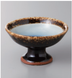
151-35-71H 630円 渦潮高台珍味 8×4.5cm