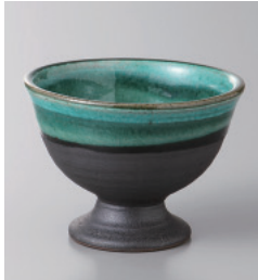
151-8-6H 1,700円 ビスイ高台珍味 6.8×5cm