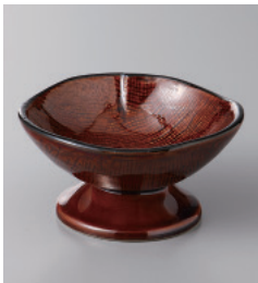
151-27-57H 770円 アメ軸高台珍味 8.1×4.1cm