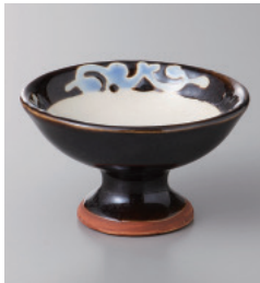
151-32-77H 650円 唐草高台珍味 8.1×4.7cm