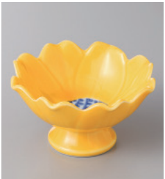
151-18-34H 1,200円 黄彩コリ型高台小附 9×4.7cm