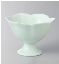
151-15-36H 1,350円 もえぎ桔梗高台珍味 8.5×6.5cm