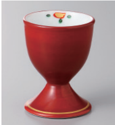
151-9-41H 1,480円 朱巻小花高台珍味 4.7×6.2cm