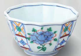
強化 100-7-5H 3,760 円 錦間取り十二角鉢 10×10×5.6cm