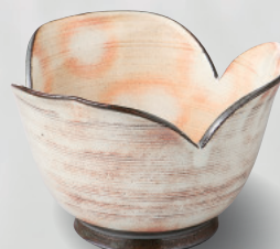
土物 100-6-1H 3,800 円 粉引印花紋割山椒小鉢 12.5×7cm