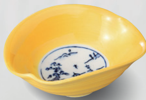
100-5-53H 3,850 円 雲型黄交趾小鉢 13×10×5.3cm