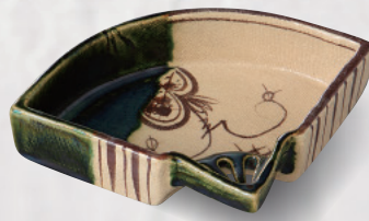
土物 100-2-73H 4,680 円 織部唐草4.0扇面鉢 12.2×11.4×3.2cm