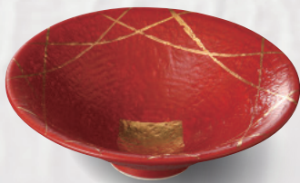
100-1-48H 4,800 円 朱巻金彩反小鉢 13.7×4.5cm