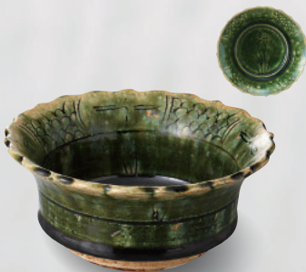
土物 100-4-2H 3,900 円 織部輪花反小鉢 12.8×6cm