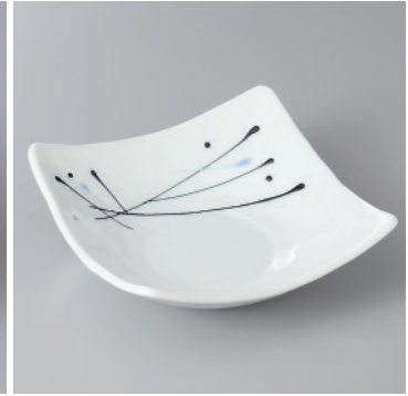
97-8-36H 1,340円 流星中鉢 16×16×5.5cm