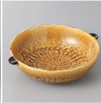
97-3-71H 1,500円 黄瀬戸耳付中鉢 17.5×15.5×4.5cm