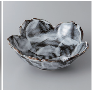
97-16-56H 1,250円 黒しのサクラ鉢 15×15×5.5cm