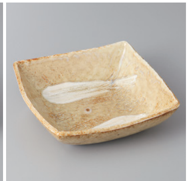
97-20-71H 1,150円 黄灰袖正角中鉢 15.2×15.2×4cm