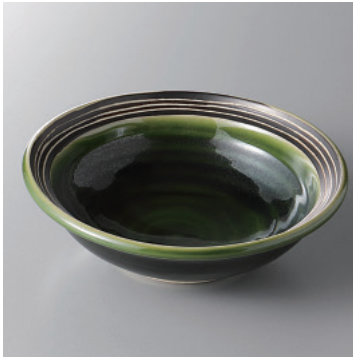
97-1-71H 1,500円 織部ライン4.8鉢 15×4.5cm