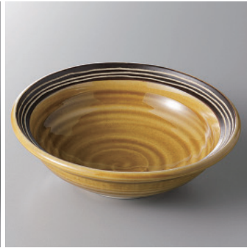
97-2-71H 1,500円 黄瀬戸ライン4.8鉢 15×4.5cm