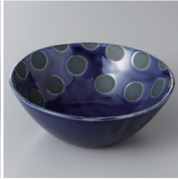
97-6-1H 1,350円 レインブルー深鉢小 14.8×5.7cm