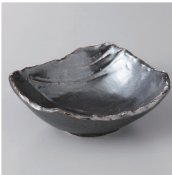
97-13-26H 1,300円 鉄結晶荒瀬型小鉢 14.5×12×5.5cm