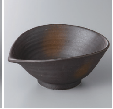
97-12-35H 1,150円 黒伊賀ねじり鉢(大) 15.1×12.6×6.3cm