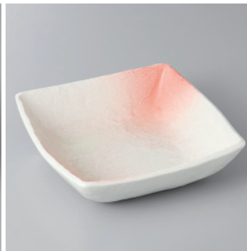
97-19-43H 1,180円 弥生くしめ角中鉢 15.2×15.2×4.4cm