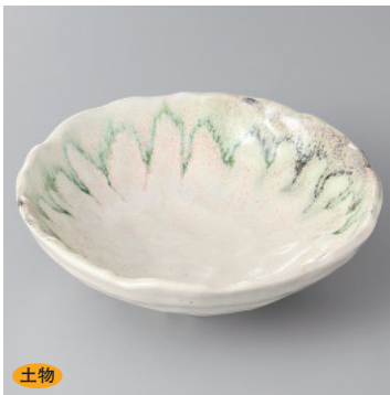
土物 97-17-23H 1,300円 窯変流し平鉢 16.5×5.3cm