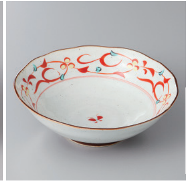
97-4-93H 1,500円 有田焼 赤絵唐草平小鉢 5入 14.5×5cm