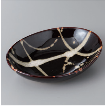
97-5-71H 1,450円 天目うのふ散しフルーツ鉢 17×12.5×3.7cm