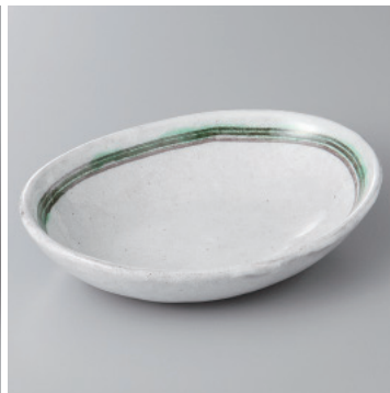
97-18-71H 1,450円 あおい楕円鉢 17×12.6×3.5cm