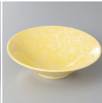
97-15-43H 1,250円 黄吹き5.0平鉢 16×4.8cm