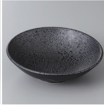
97-10-55H 1,300円 墨おどし4.5浅ボール 14×4cm