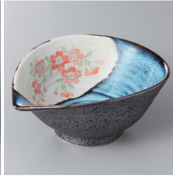
97-11-23H 1,400円 清流サクラネジリ鉢(大) 15.2×12.7×6.4cm