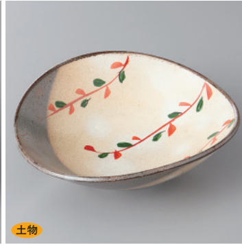
土物 97-7-1H 1,350円 芽吹変型浅鉢 15.2×14×4.5cm