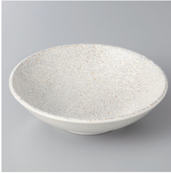
97-9-55H 1,300円 飛白4.5浅ボール 14×4cm